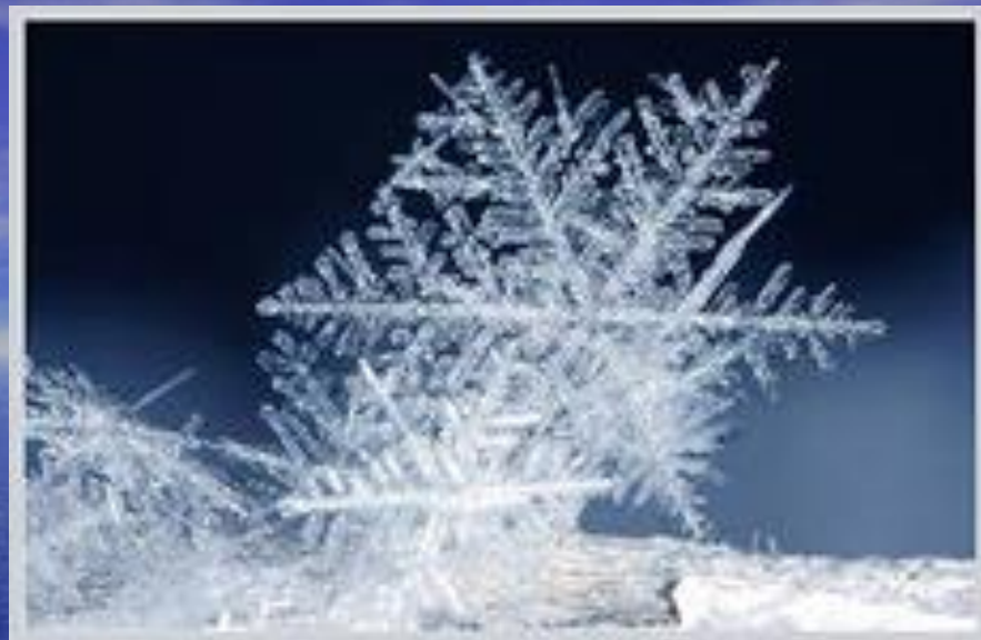
ВОДА В ТВЕРДОМ СОСТОЯНИИ