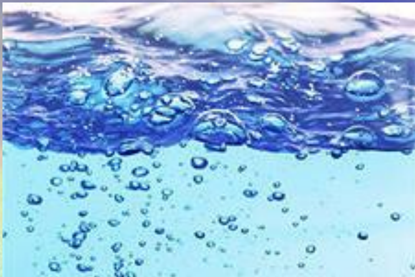
ВОДА В ЖИДКОМ СОСТОЯНИИ