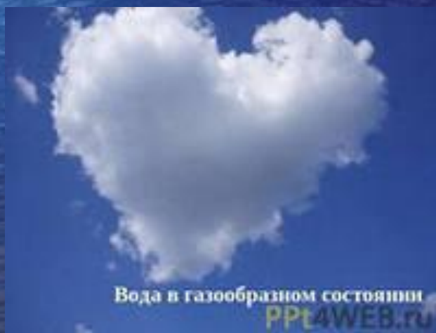
ВОДА В ГАЗООБРАЗНОМ СОСТОЯНИИ