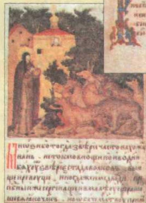
Рукописные книги времён Древней Руси.

Попробуй помочь Илюше. Найди знакомые и незнакомые тебе начертания букв.