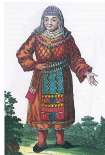
"ЧУХОНСКАЯ КРЕСТЬЯНСКАЯ БАБА" - ВОДЬ XVIII ВЕКА РИСУНОК И.-Г. ГЕОРГИ. 1776 ГОД