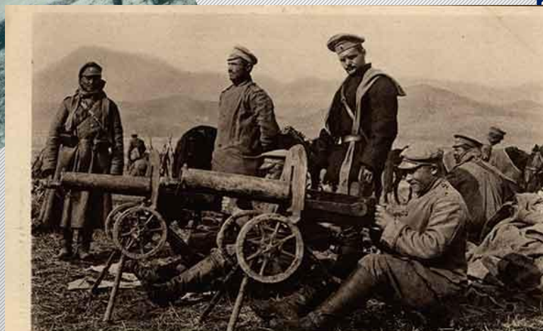
Вторая отечественная война 1914-1915 гг.