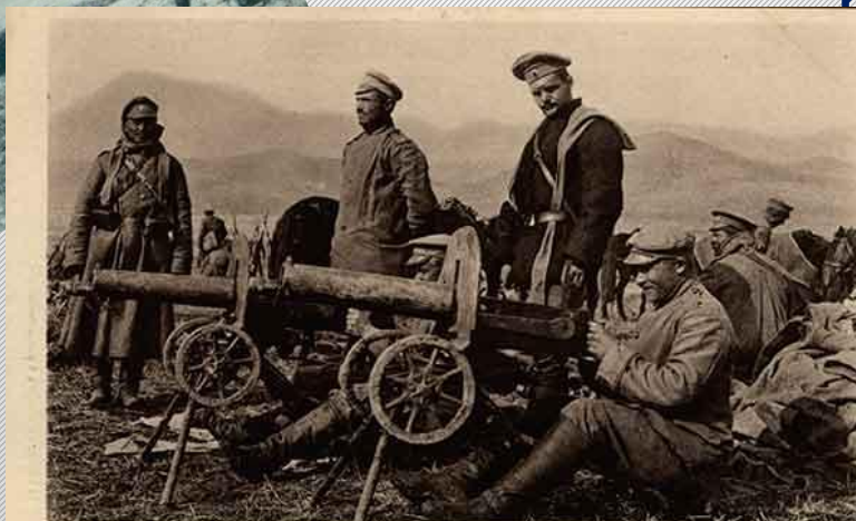
Вторая отечественная война 1914-1915 гг.