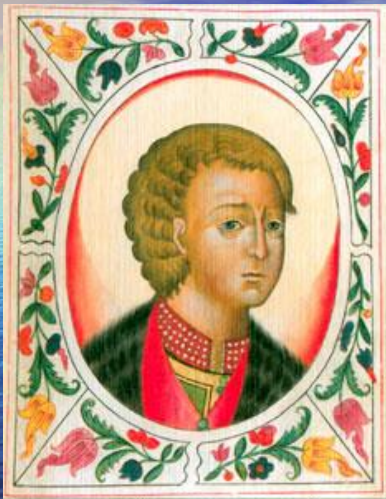
Великий князь киевский Юрий Долгорукий