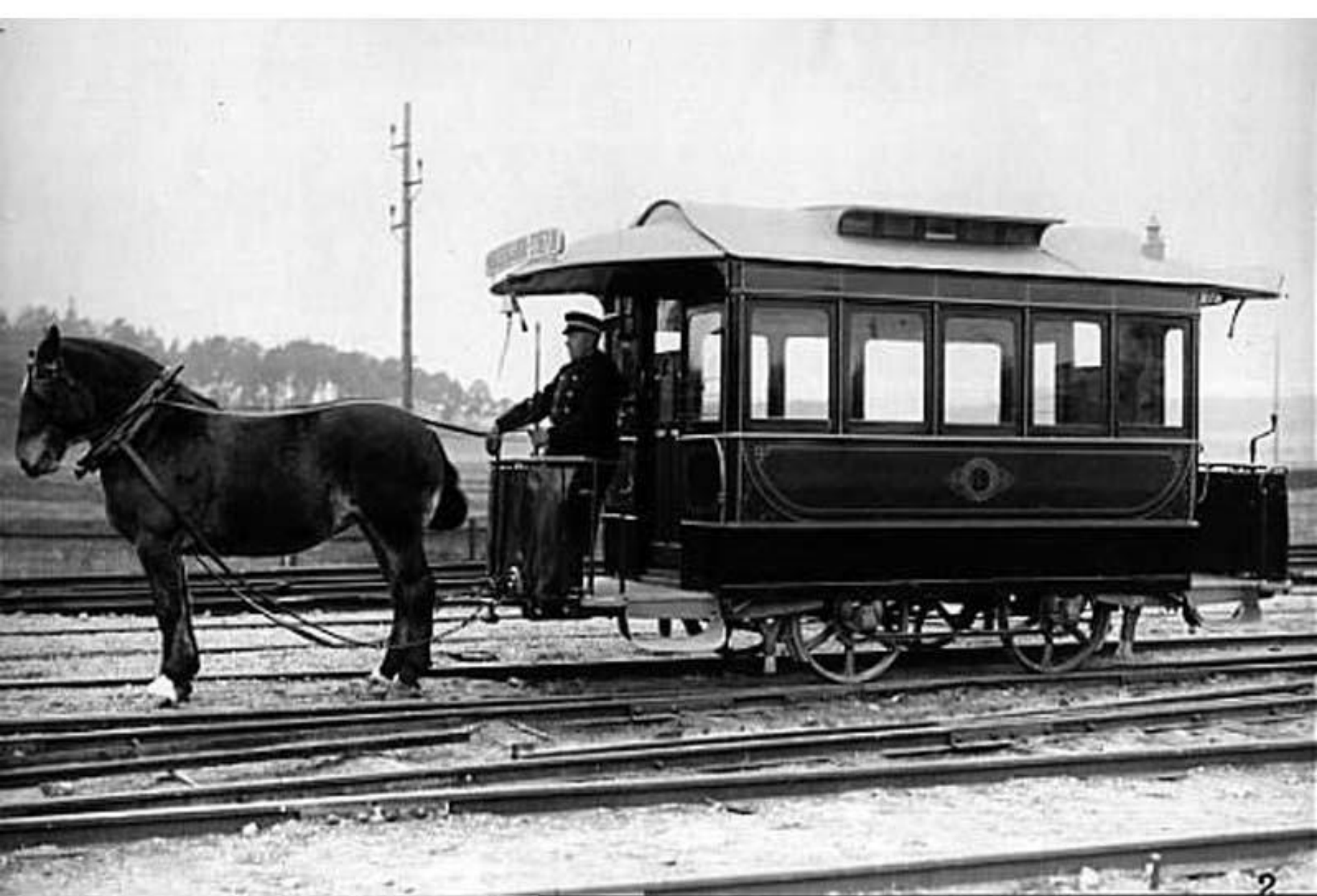
Enspänd hñstspårvagn /Museievagn/