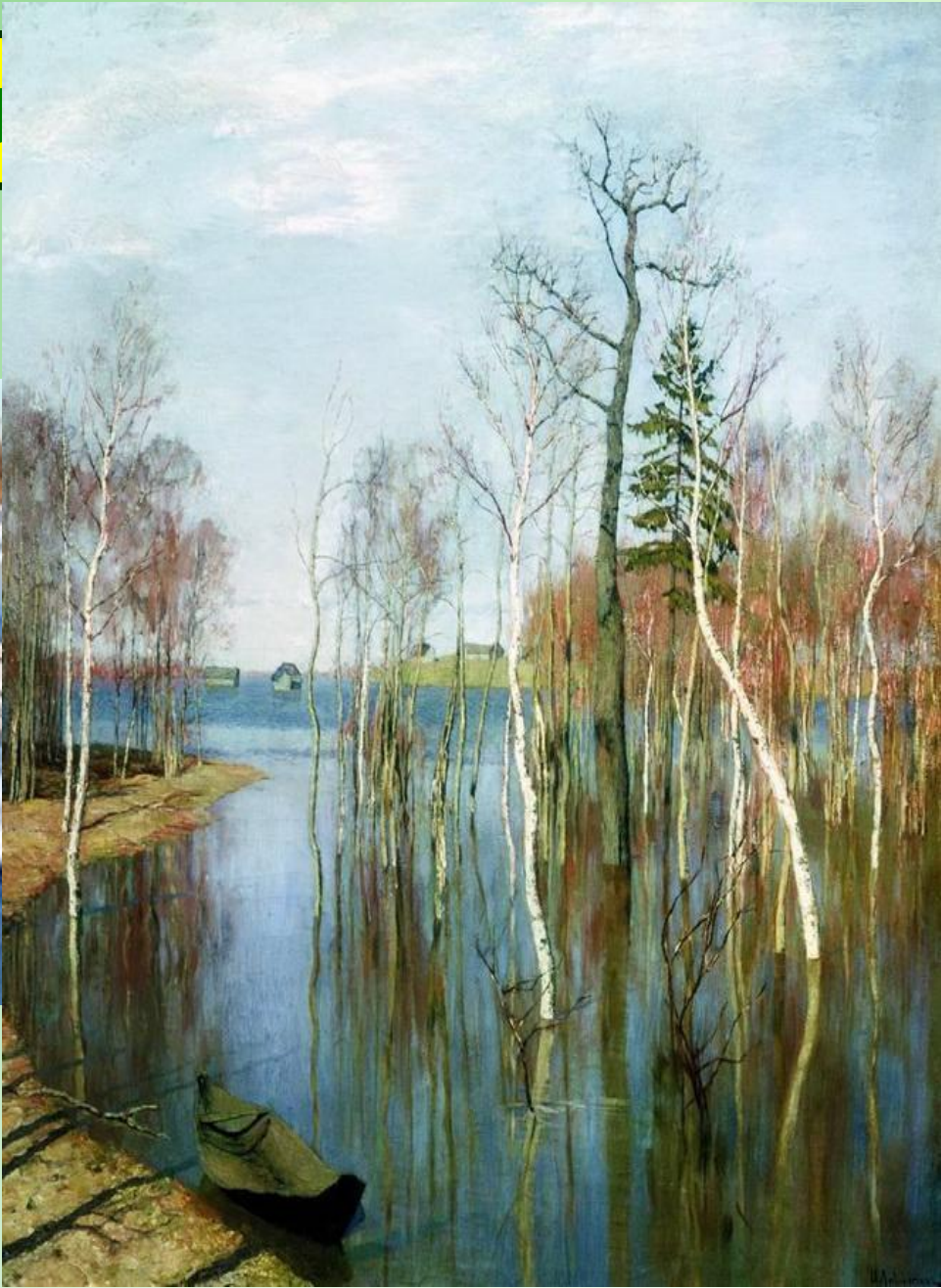
И.Левитан. Весна. Большая вода