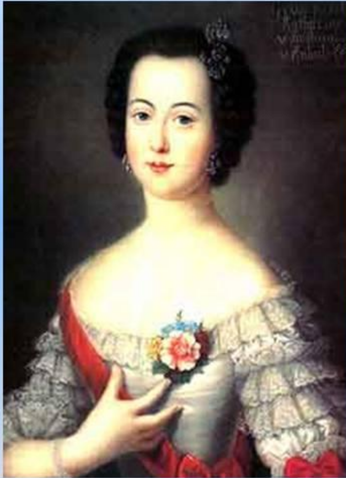
Великая княгиня Екатерина Алексеевна - будущая императрица Екатерина II

Когда в 14 лет Екатерина II переехала в Россию, здесь царствовала Елизавета Петровна. Острый и живой ум, красота немецкой принцессы обратили на себя внимание императрицы. Блистая при русском дворе красотой и умом, Екатерина весь свой досуг употребляла на самообразование. Она много читала. Едва ли в целой России была женщина образованнее нее. Русский язык Екатерина выучила так, что знала множество поговорок и писала на нем сочинения.