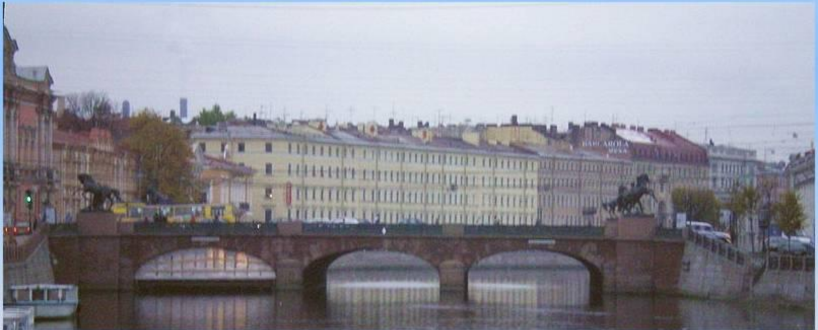
Каменные мосты Петербурга. Аничков мост.

Набережные реки Невы одеваются в гранитные берега, строятся каменные и чугунные мосты через реки и каналы.