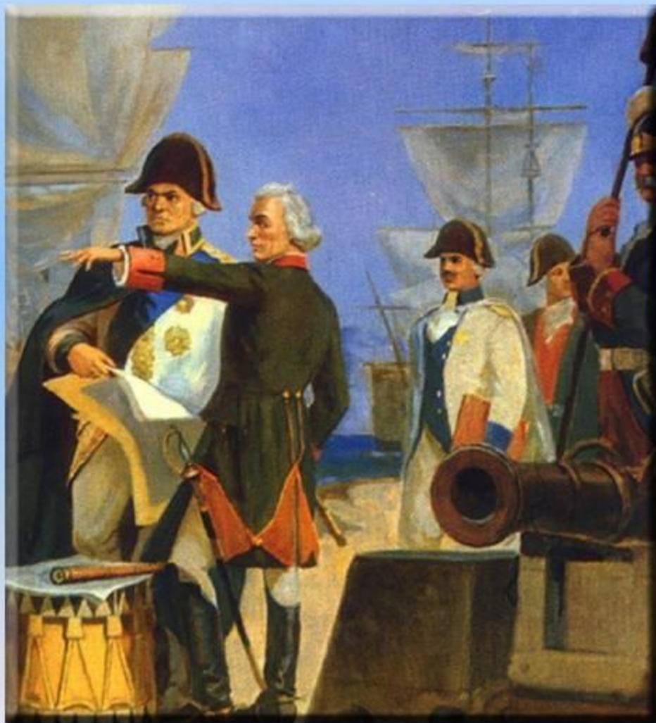
А.В.Суворов и Ф.Ф.Ушаков

В период царствования Екатерины II Россия вела продолжительные войны, в первую очередь за выход к Чёрному морю. В этой войне русскими войсками руководили А. С. Суворов и Ф. Ф. Ушаков.