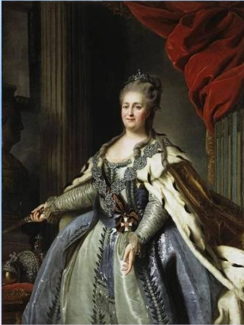
Годы правления 1762 - 1796.

После смерти супруга Петра III в 1762 году Екатерина стала императрицей.