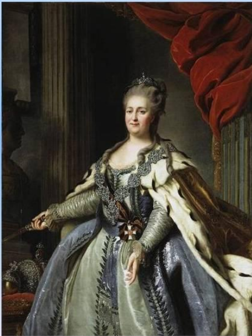
Годы правления 1762 - 1796.

После смерти супруга Петра III в 1762 году Екатерина стала императрицей.