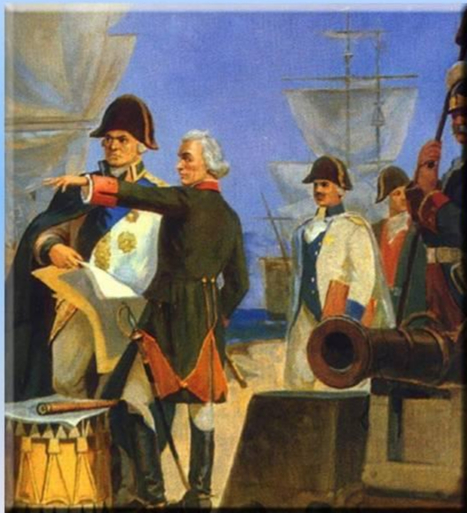
А.В.Суворов и Ф.Ф.Ушаков

В период царствования Екатерины II Россия вела продолжительные войны, в первую очередь за выход к Чёрному морю. В этой войне русскими войсками руководили А. С. Суворов и Ф. Ф. Ушаков.