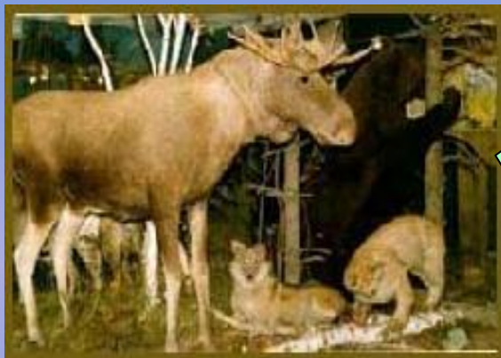
Диорама «Таёжная зона»

Наша область располагается в пределах трёх природных зон: лесной, лесостепной и степной. Природные зоны Омской области сменяются одна за другой в направлении с севера на юг. Резкие границы провести между ними невозможно, они сменяются постепенно.