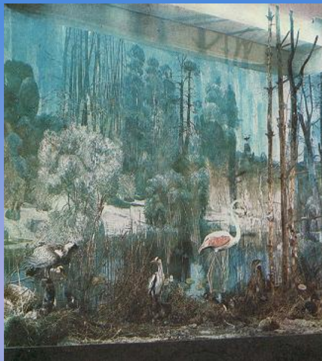
ДИОРАМА «ОЗЁРА И БОЛОТА»

Однако благодаря сохранившимся родникам, в старице Иртыша возникла речка Замарайка, протекавшая навстречу течению воды в новом русле реки. Когда при строительстве дамбы Ленинградского моста через Иртыш речка Замарайка оказалась перегороженной, ее вода заполнила цепочку влажных впадин - образовались озера Птичьей Гавани. Постепенно эти водоемы заросли водой и околководной растительностью, заселились различными животными.