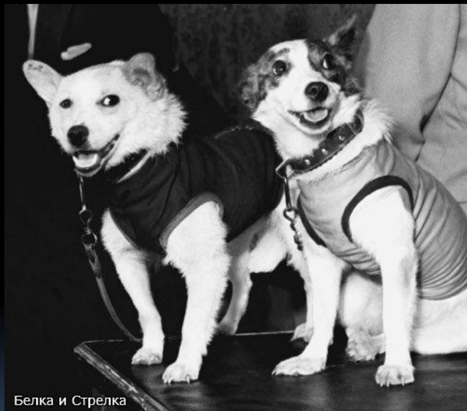
Белка и Стрелка