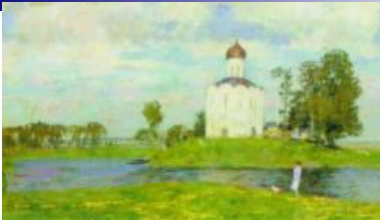
С.В.Герасимов «Церковь Покрова на Нерли»