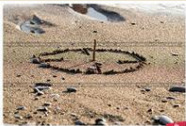
Солнечные часы © Игорь П. П. Шибанов. Лепка