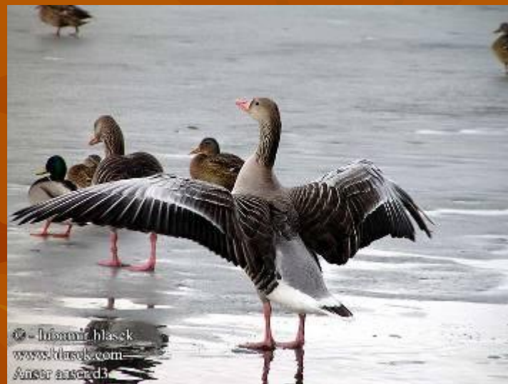
Цапли и гуси летят шеренгой