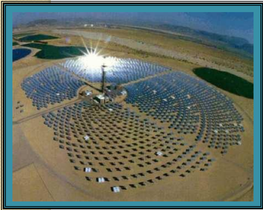
Солнечная электростанция (СЭС)