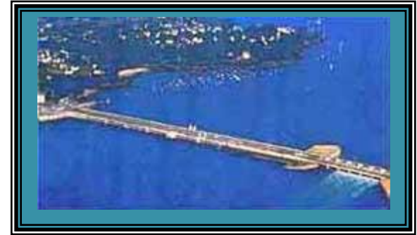
Приливная электростанция (ПЭС)