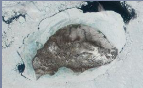
Снимок из космоса