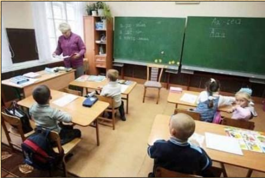
Современная сельская школа