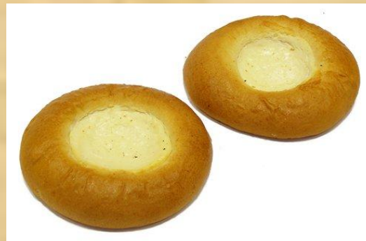
Сдоба с начинкой