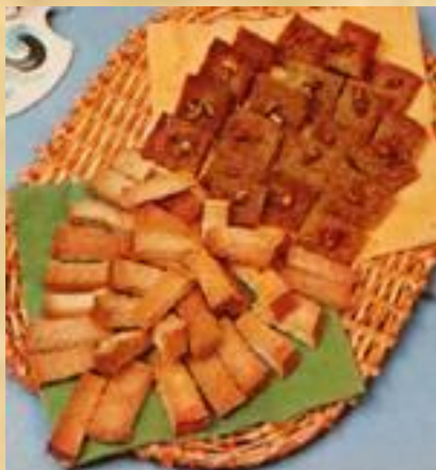
Гренки с чесноком