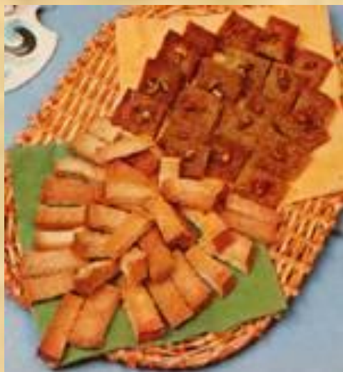
Гренки с чесноком