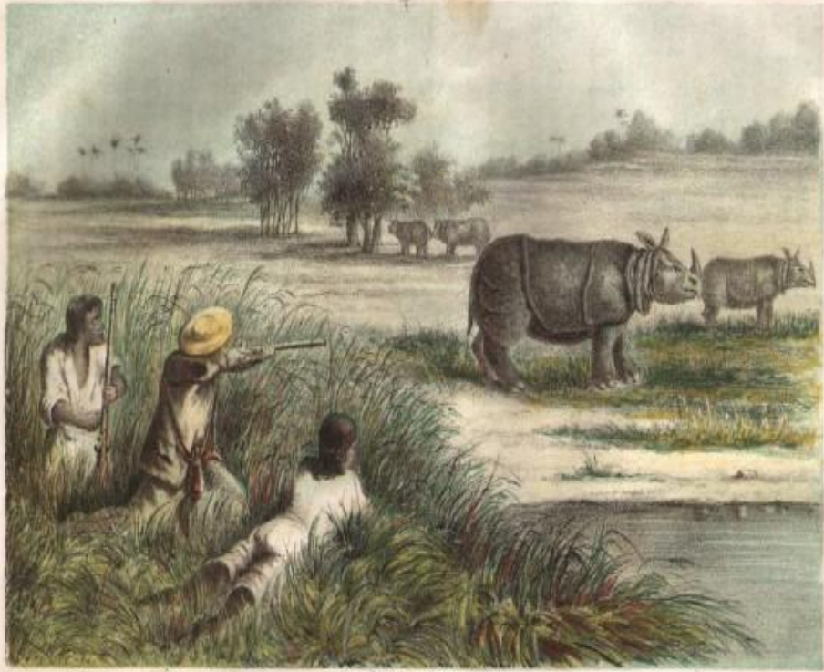
Verlag • Theodor Thiele in Berlin Auch ein Anstand Druck • Hehr, Delius.

В дикой природе осталось всего две популяции, в общей сложности — менее 60 животных!