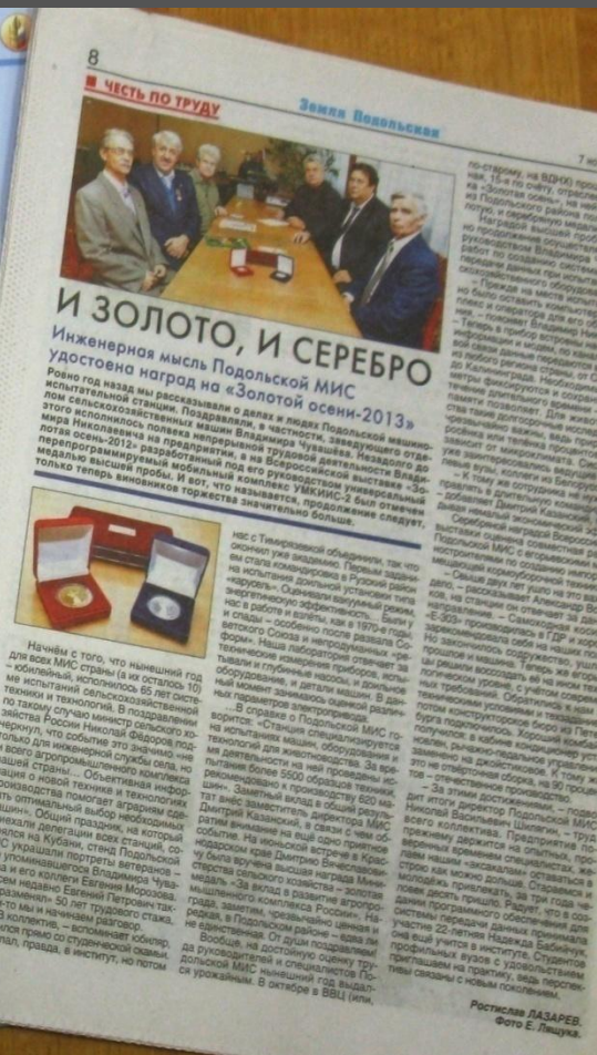
Ростислав ДАШАЕВ.