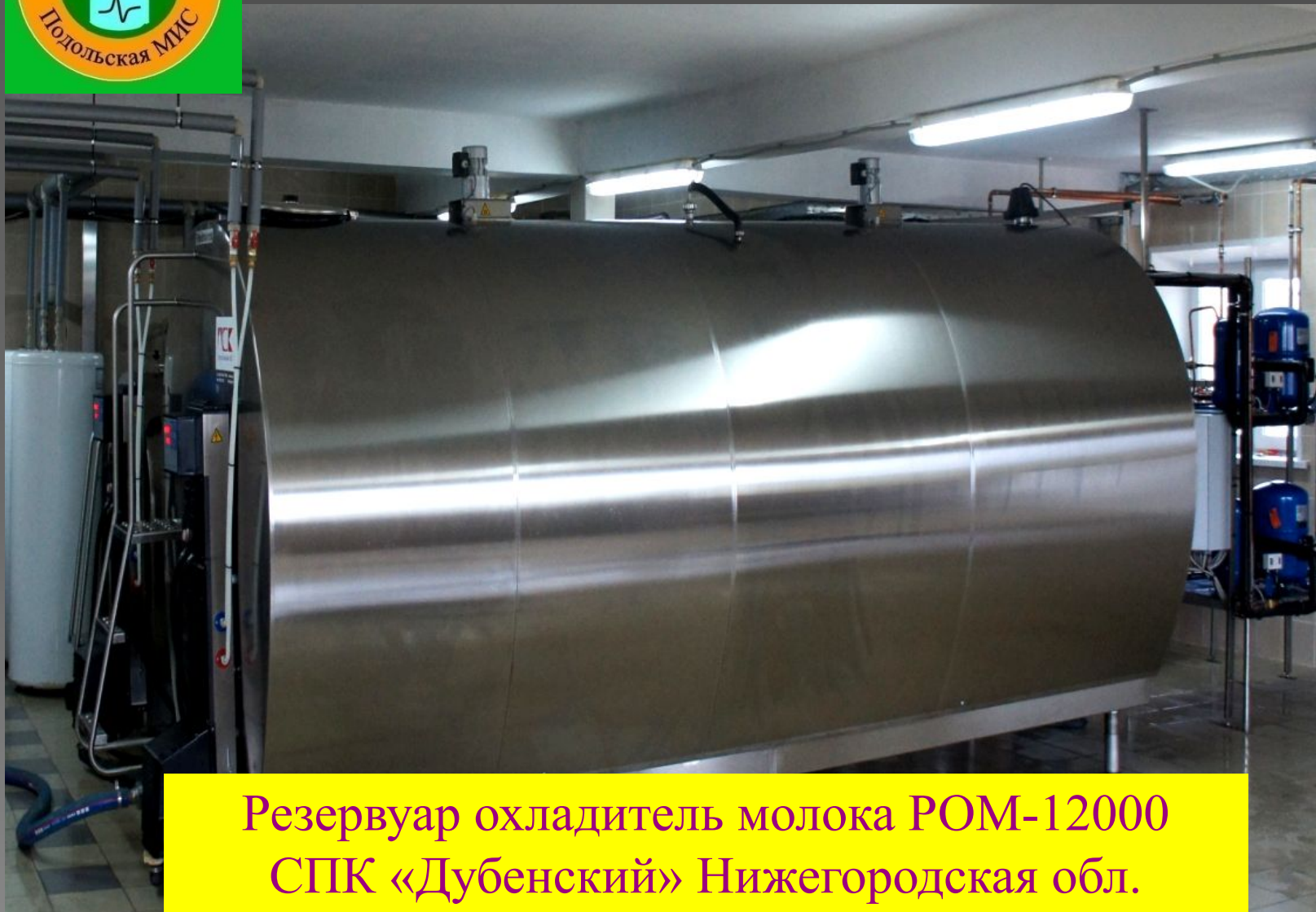
Резервуар охладитель молока РОМ-12000 СПК «Дубенский» Нижегородская обл.