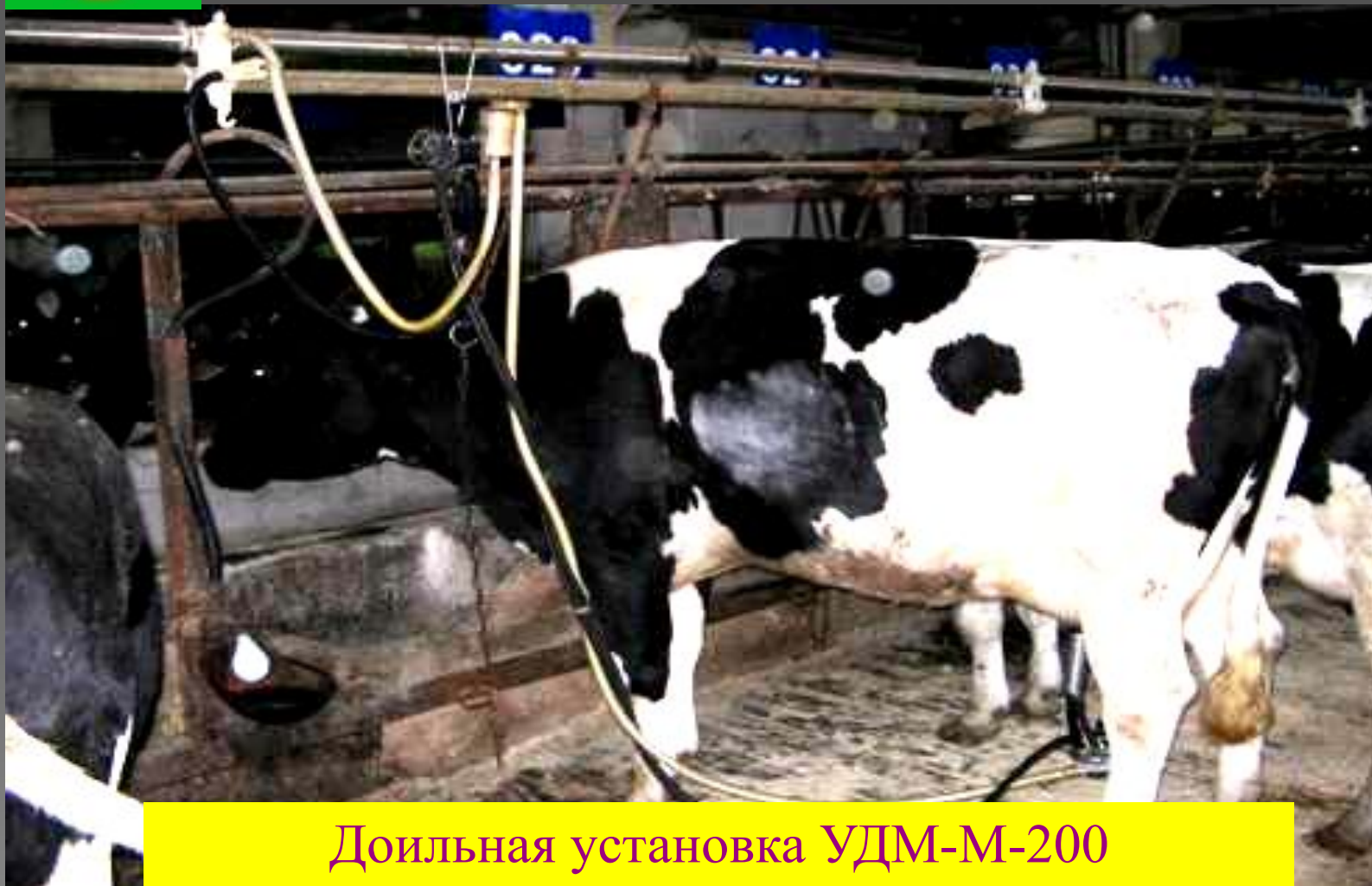
Доильная установка УДМ-М-200 ООО «Фемакс», Владимирская область