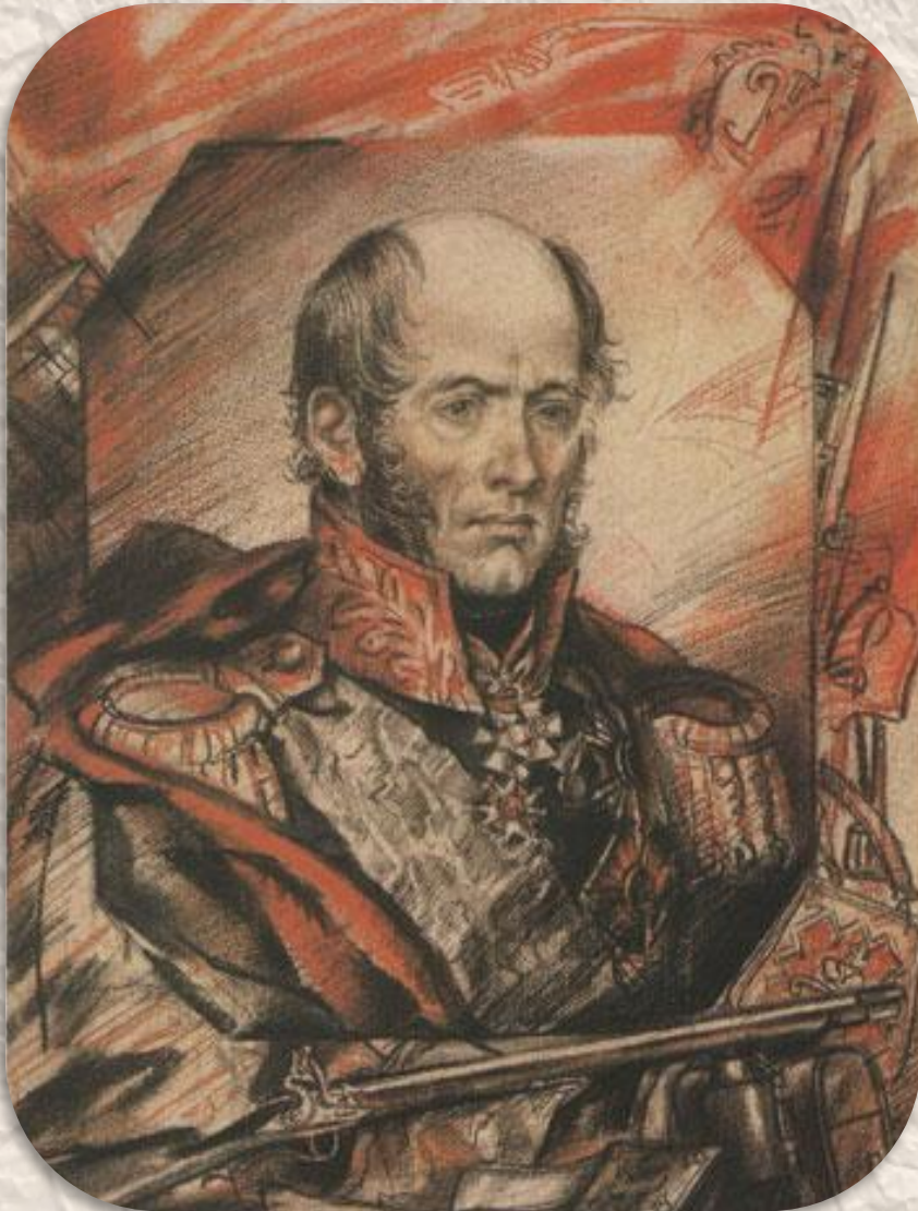
Михаил Богданович Барклай де Толли