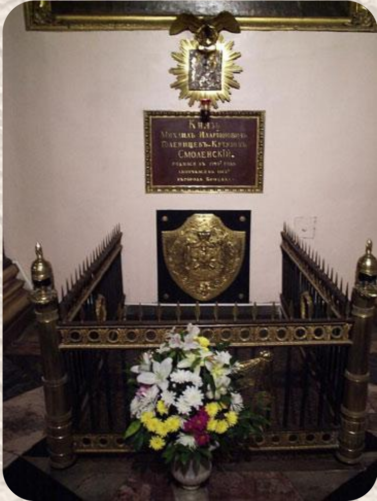
Могила М. И. Кутузова в Казанском соборе.