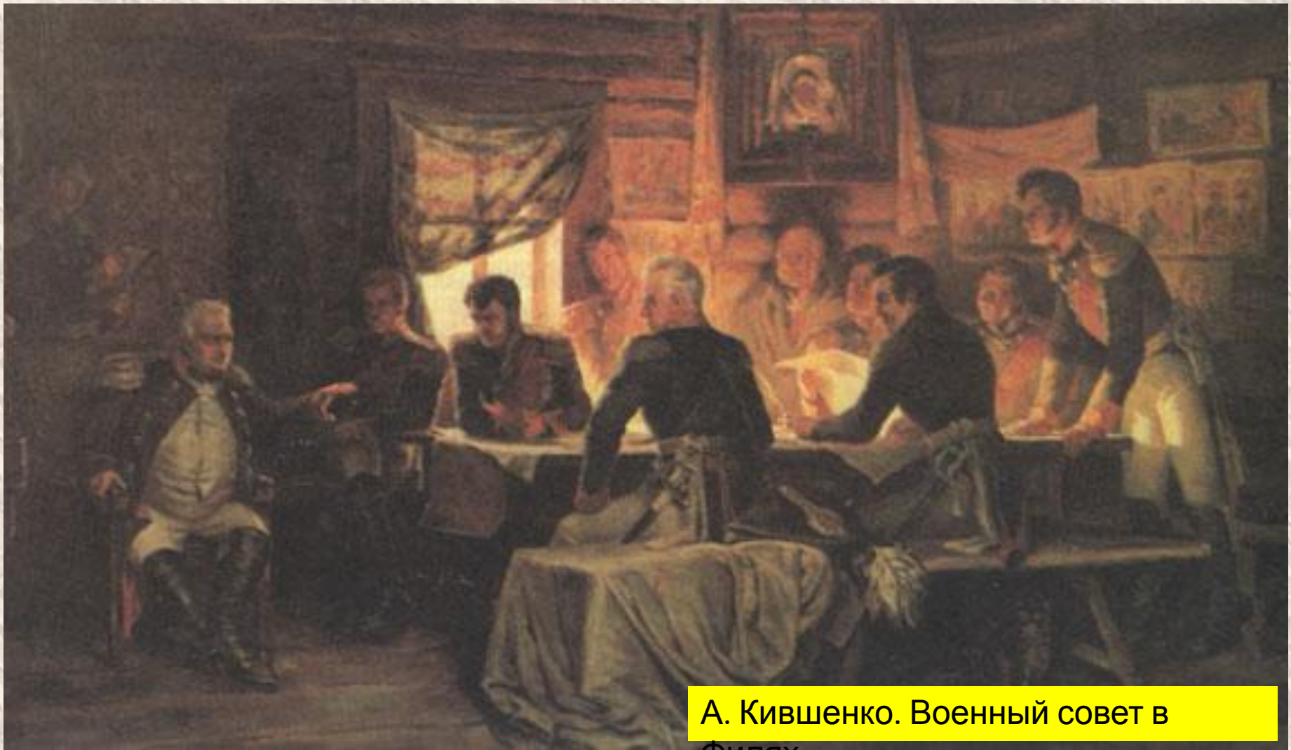
А. Кившенко. Военный совет в Филях

Русские войска отступали к Москве. Кутузов созывает в Филях военный совет и ставит вопрос: давать бой под Москвой или сдать древнюю столицу? Решающими стали слова Кутузова: «Пока цела армия, цела и Россия». Было решено оставить Москву.