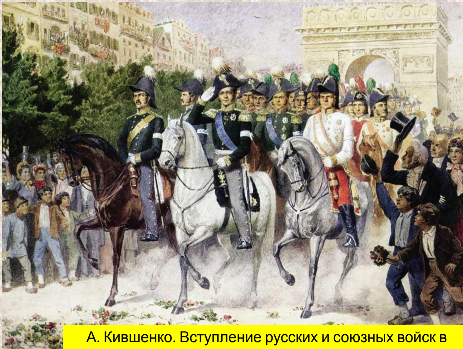
А. Кившенко. Вступление русских и союзных войск в Париж.

В 1814 году русские войска и их союзники вошли в Париж. Так закончилась попытка поставить Россию на колени.