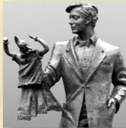
Памятник Сергею Образцову