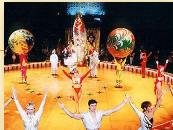
Большой Московский Государственный цирк