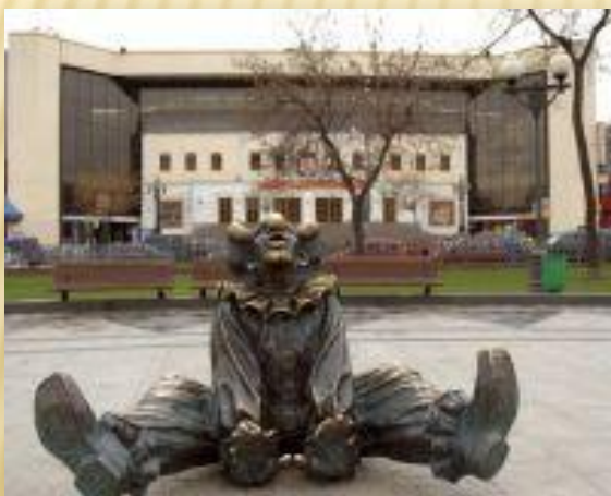
Московский цирк на Цветном бульваре