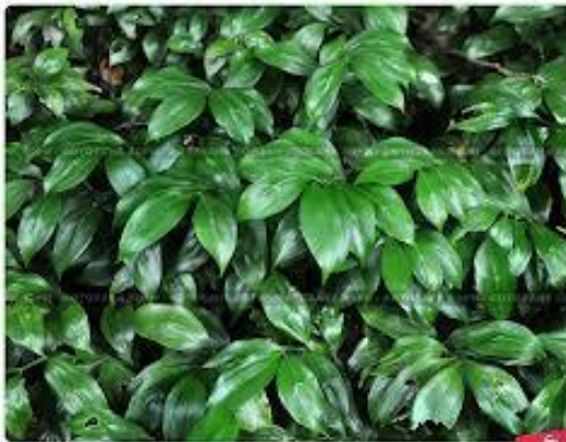
Иглица колхидская, Западный Кавказ