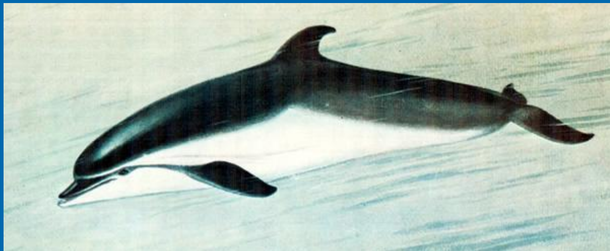
дельфин черноморская афалина