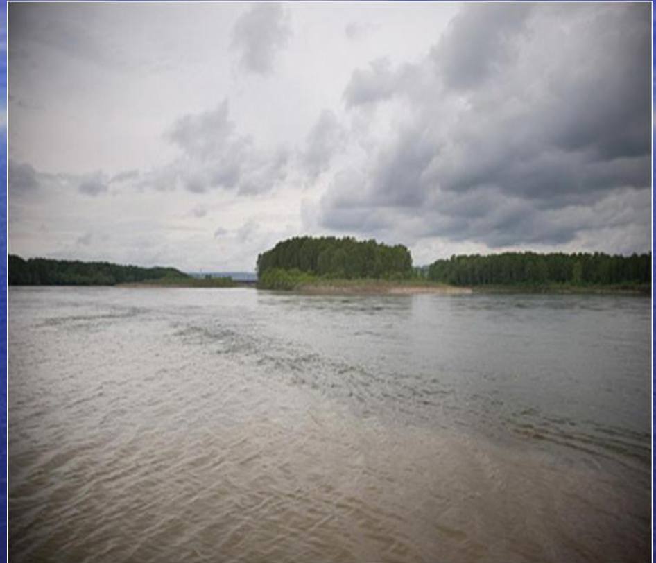
Место слияния Кондомы и Томи