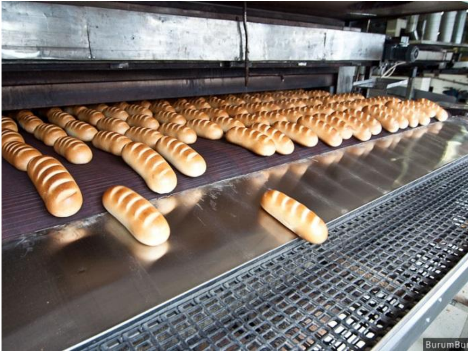
Готовый хлеб выходит из печи