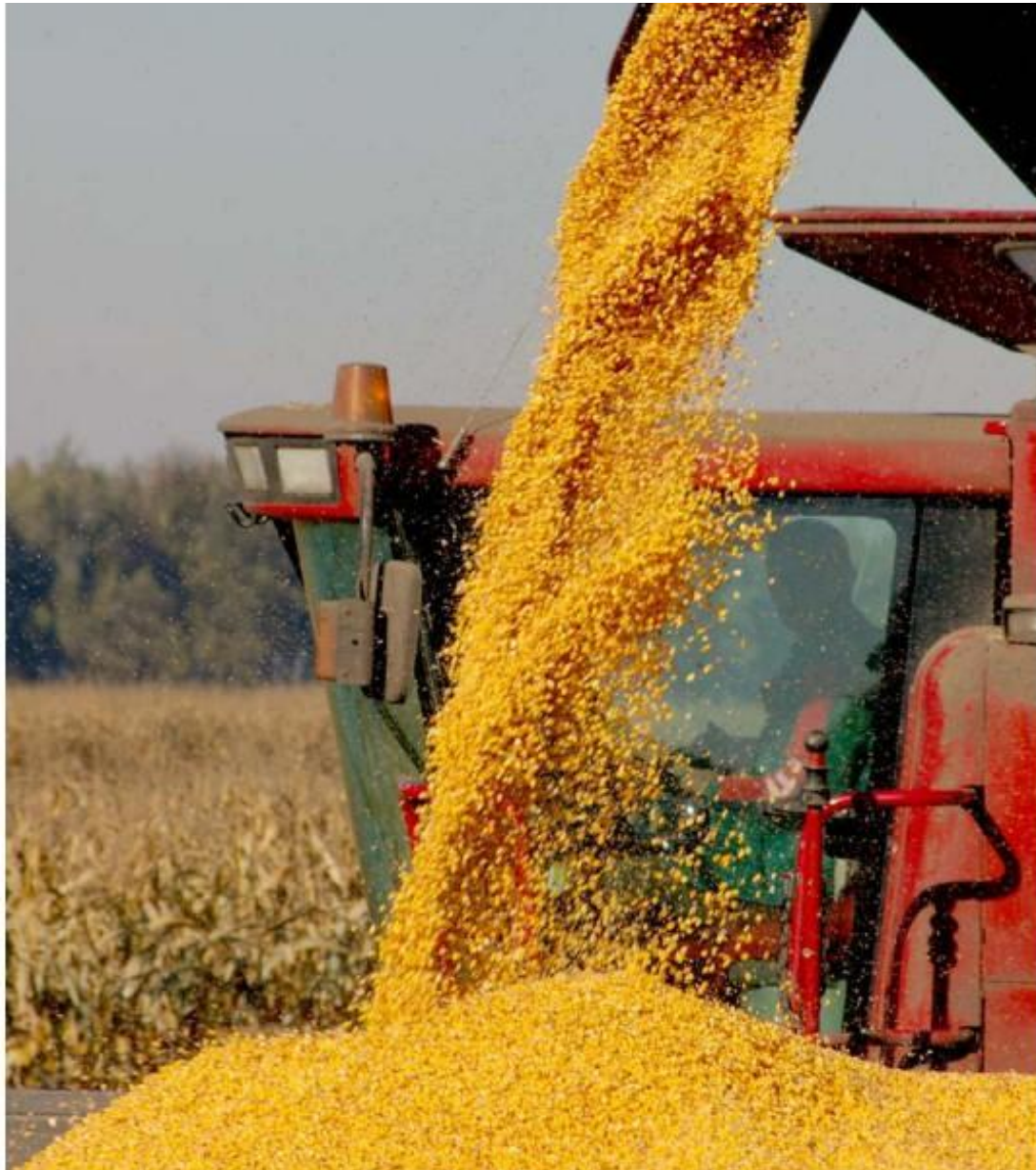
Богатый урожай хлеба