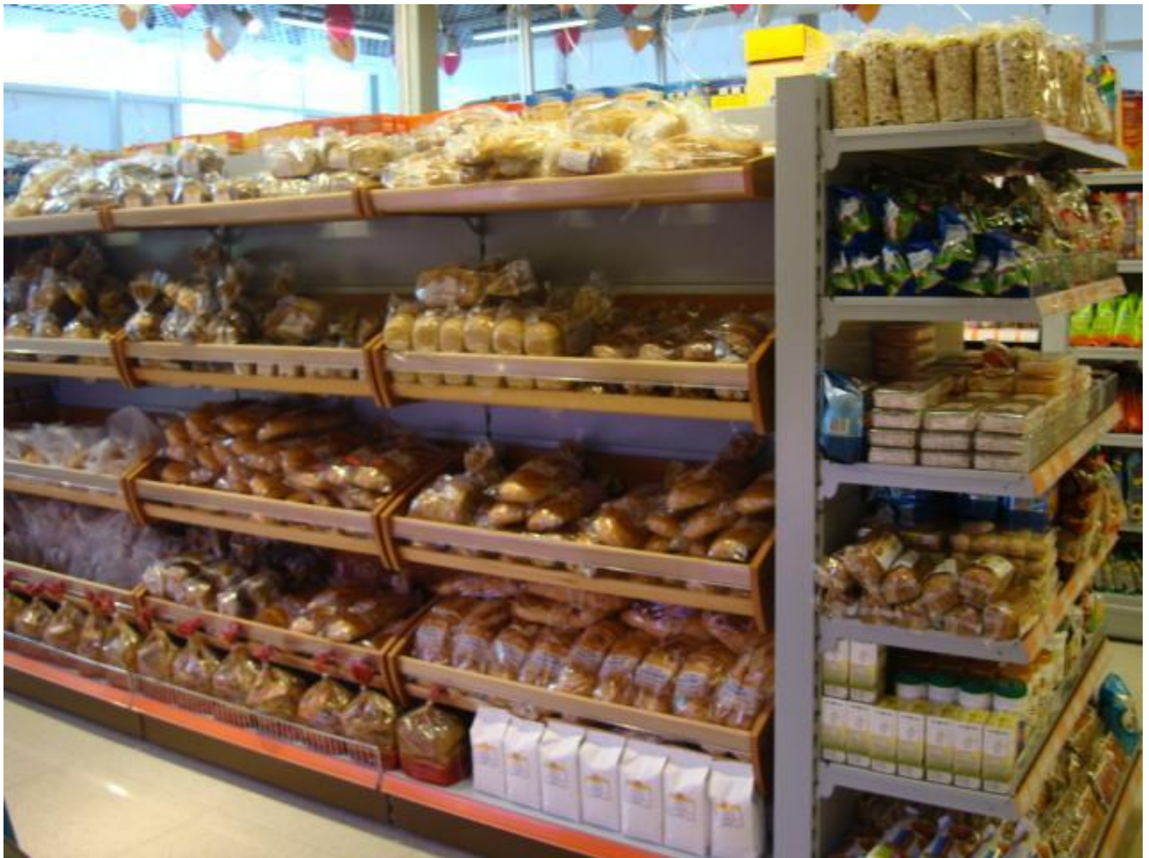
Вот готовый хлеб привезли в магазин