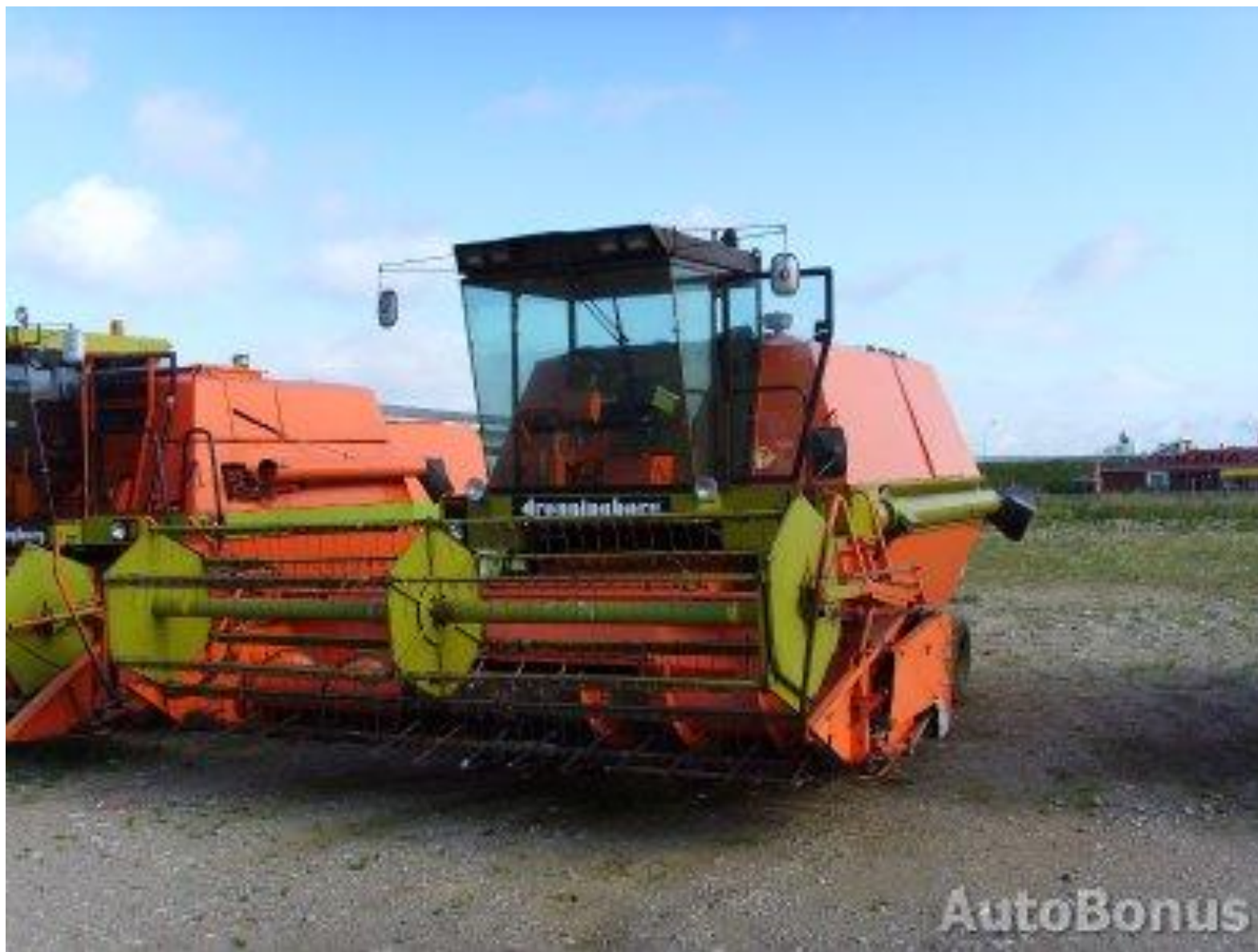
Так выглядят хлебоборочные комбайны