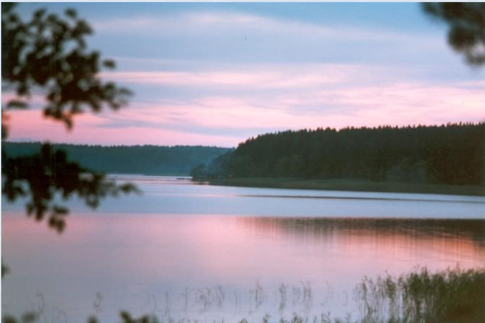
Самое красивое озеро Русской равнины – Селигер.