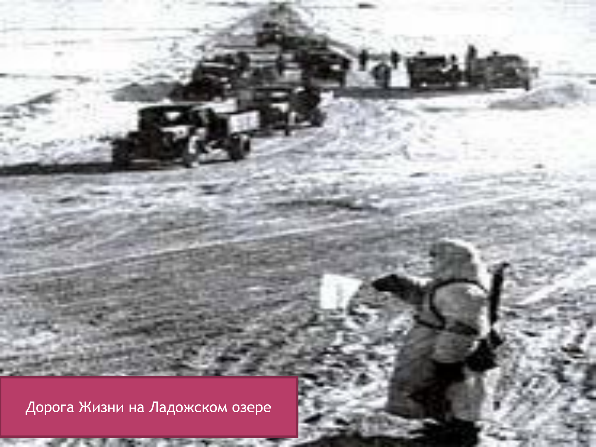
Дорога Жизни на Ладожском озере