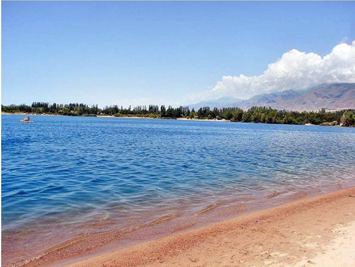
Озеро Иссык Куль