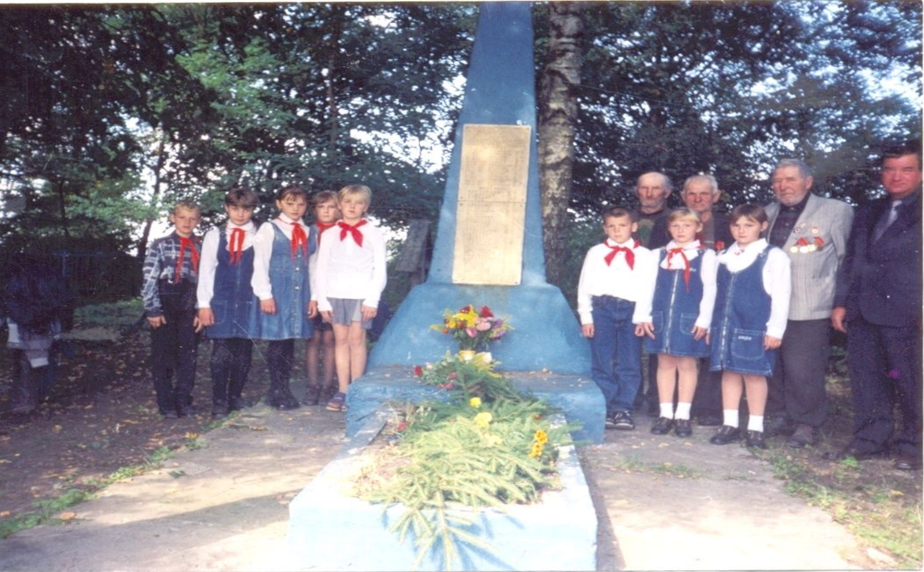
Памятник воинам и партизанам в д. Верхние Новосёлки