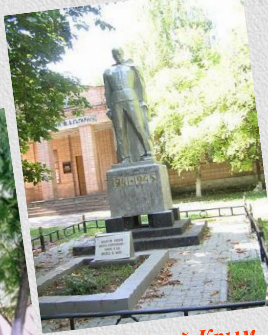
х. Красный Крым