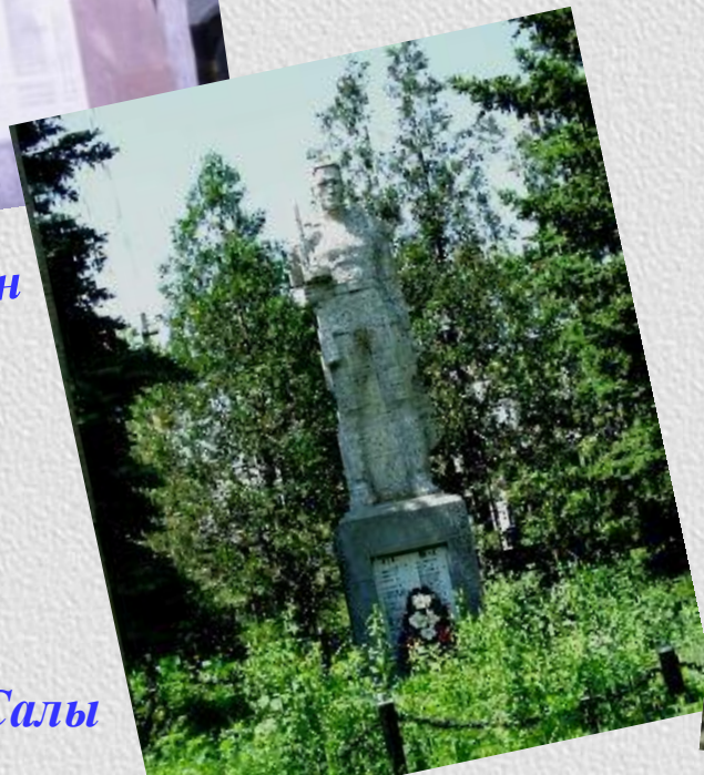
с. Султан Салы