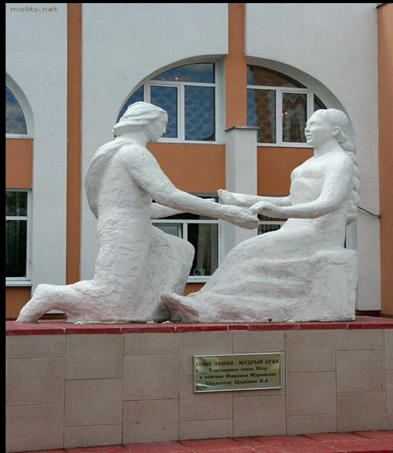
СВЯТЫЕ ЛЮБВИ - МУДРЫЙ БРАК — Благовещенский храм, Петру и Февронии, Муромский Скульптор: Щербатов И.А.