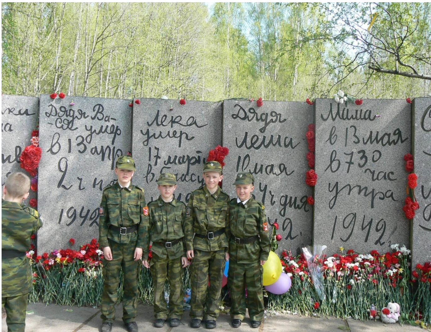
Памятник в Санкт-Петербурге