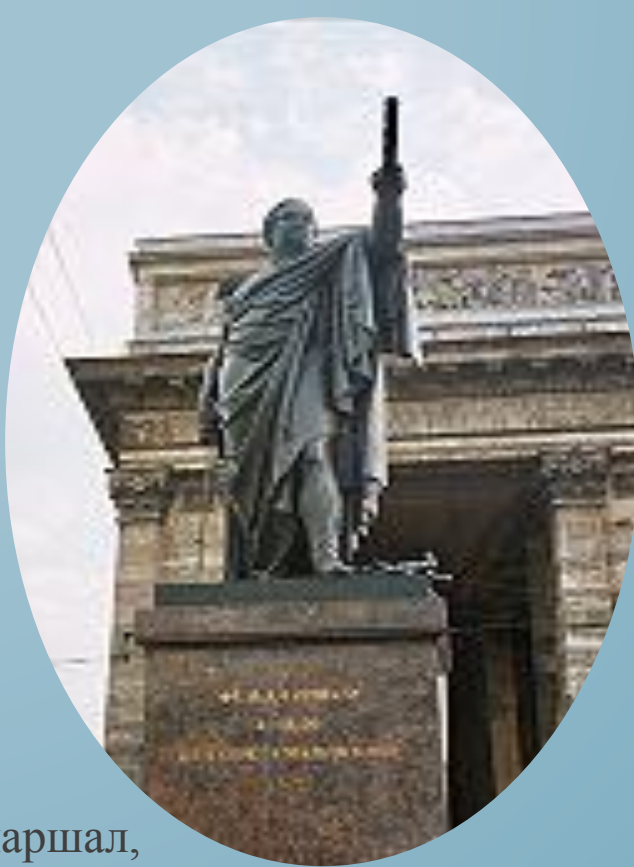
Фельдмаршал, граф Голенищев-Кутузов