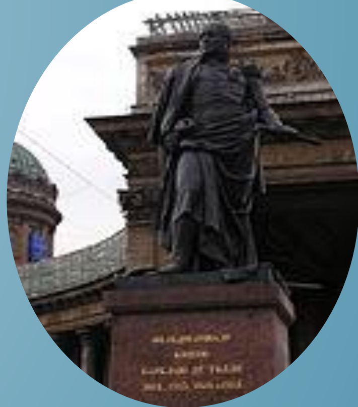
Генерал Барклай Де Толли

В 1837 году, когда страна праздновала двадцатипятилетие победы над Наполеоном, перед Казанским собором были торжественно открыты памятники героям Отечественной войны 1812 года, главнокомандующим М. И. Кутузову и М. Б. Барклаю-де-Толли. Они были выполнены по рисункам скульптора Б. Орловского и отлиты в бронзе мастером В. Екимовым. Проект постамента для памятников был разработан архитектором В. Стасовым. Сооружением памятников руководил архитектор К. Тон.