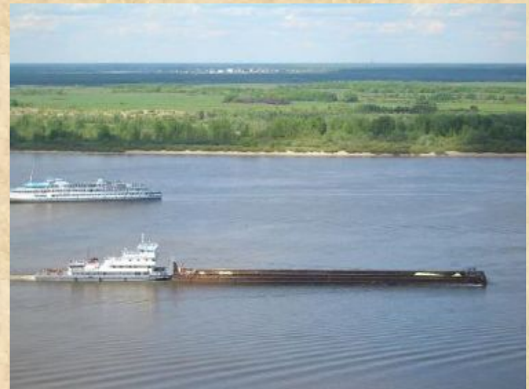
Судоходство на Волге.

Волга – это река-труженица, артерия жизни, мать русских рек, воспетая нашим народом.