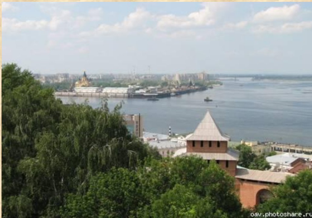
«Стрелка» у слияния Волги и Оки.