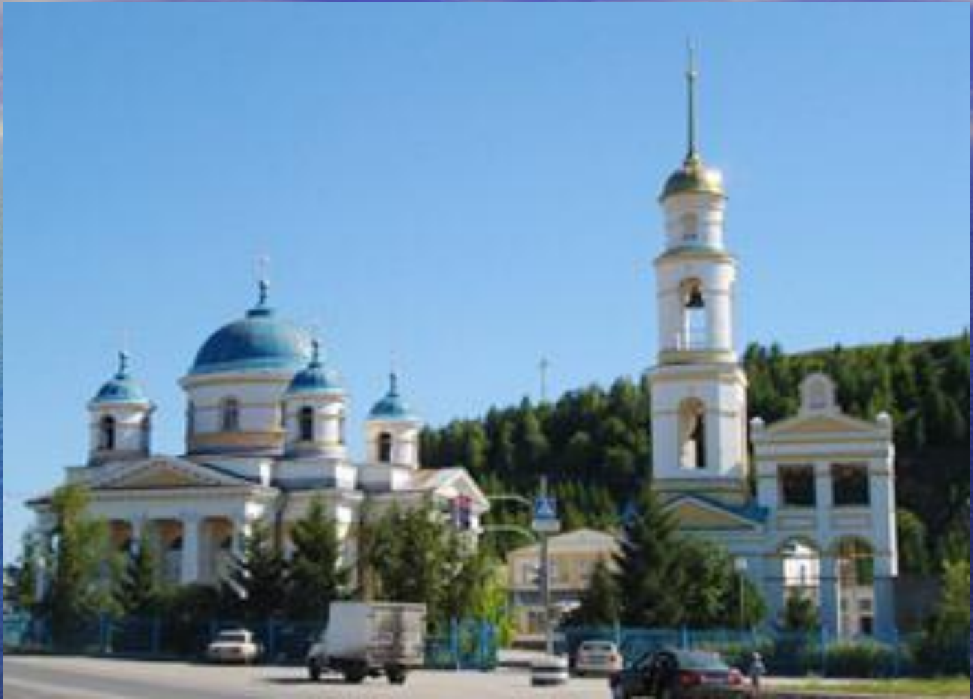
Христорожественская церковь у Царева кургана