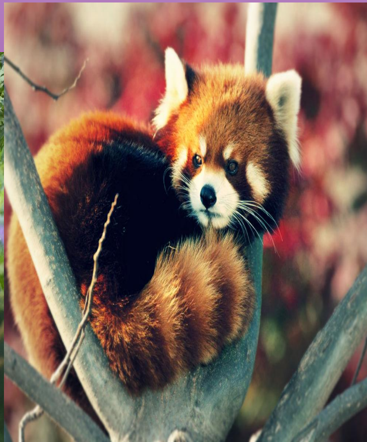
Малая красная панда