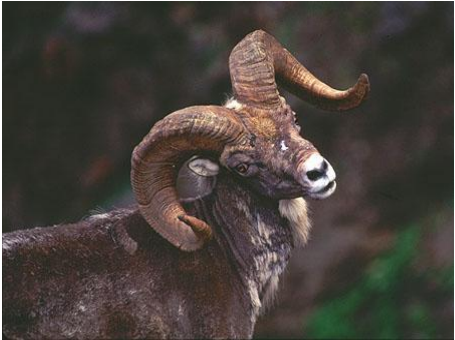
снежный баран (толсторог)