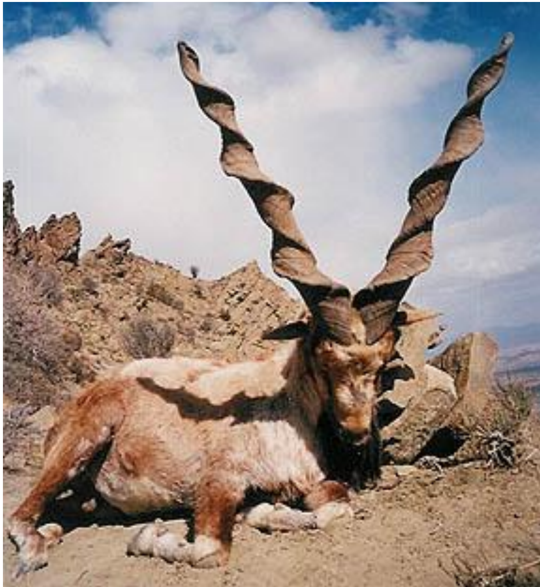
мархур (винторогий козёл)