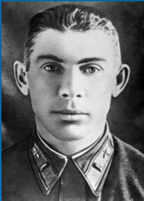
Гастелло Николай Францевич 06.05.1908 - 26.06.1941 Герой Советского Союза