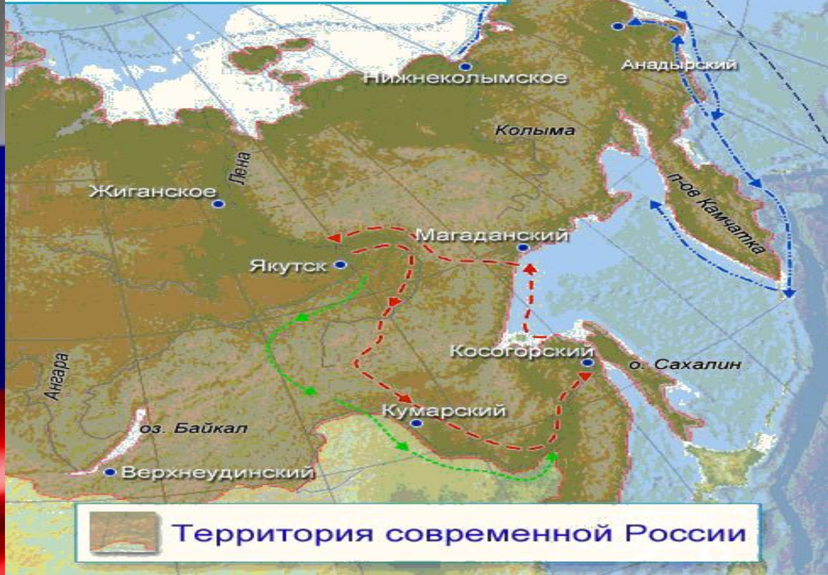
Территория современной России