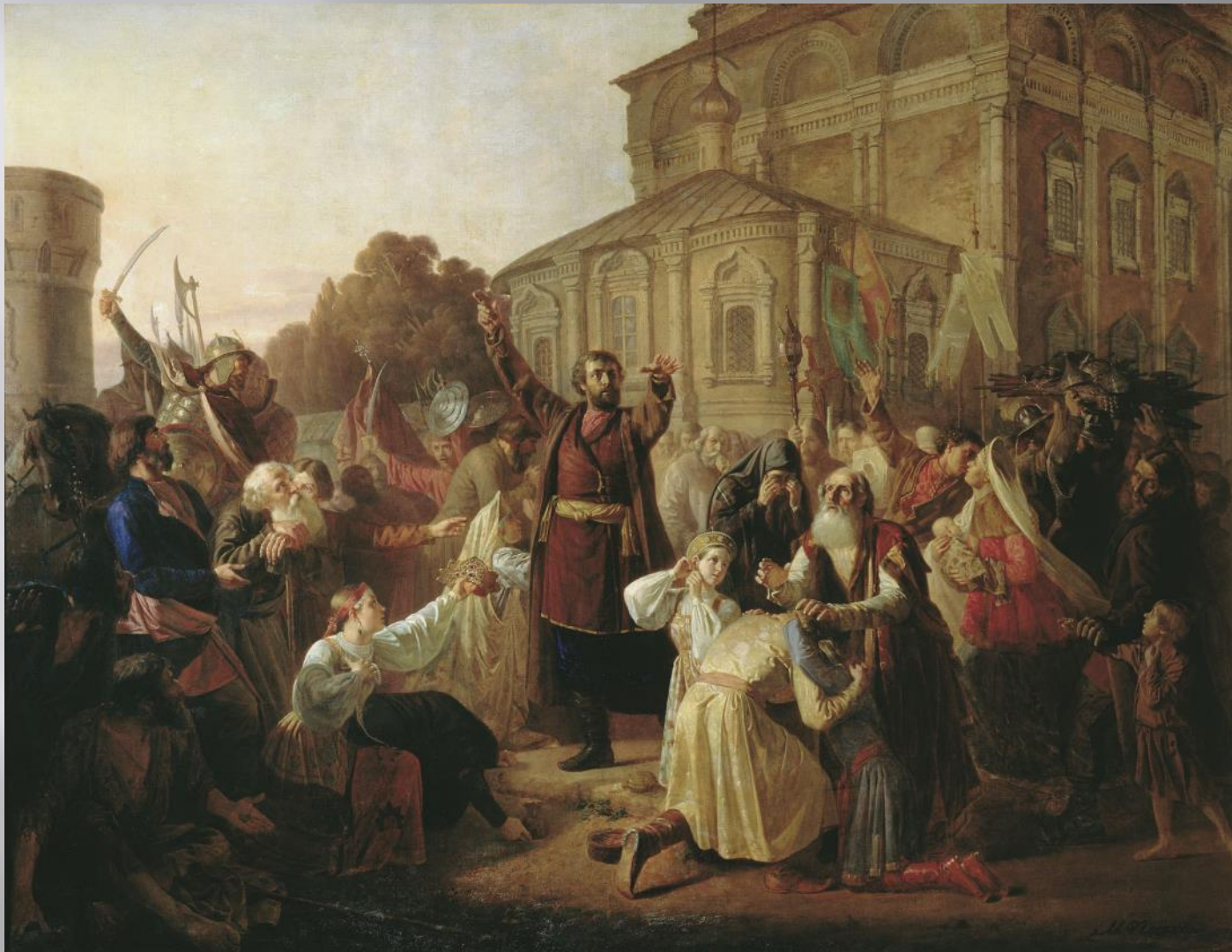
К.Минин обращается с воззванием к жителям Нижнего Новгорода.