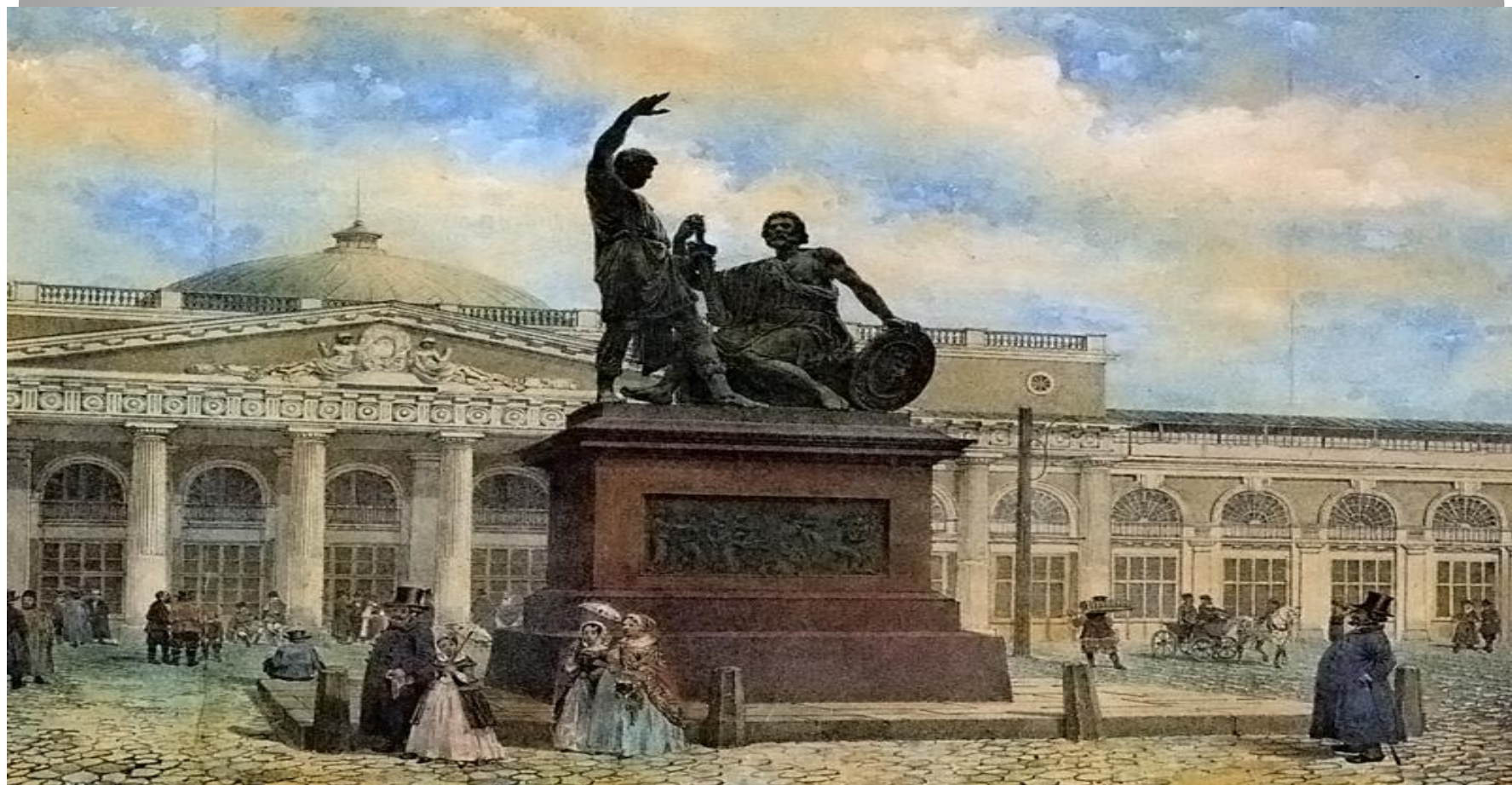
Памятник Кузьме Минину и Дмитрию Пожарскому в Москве.