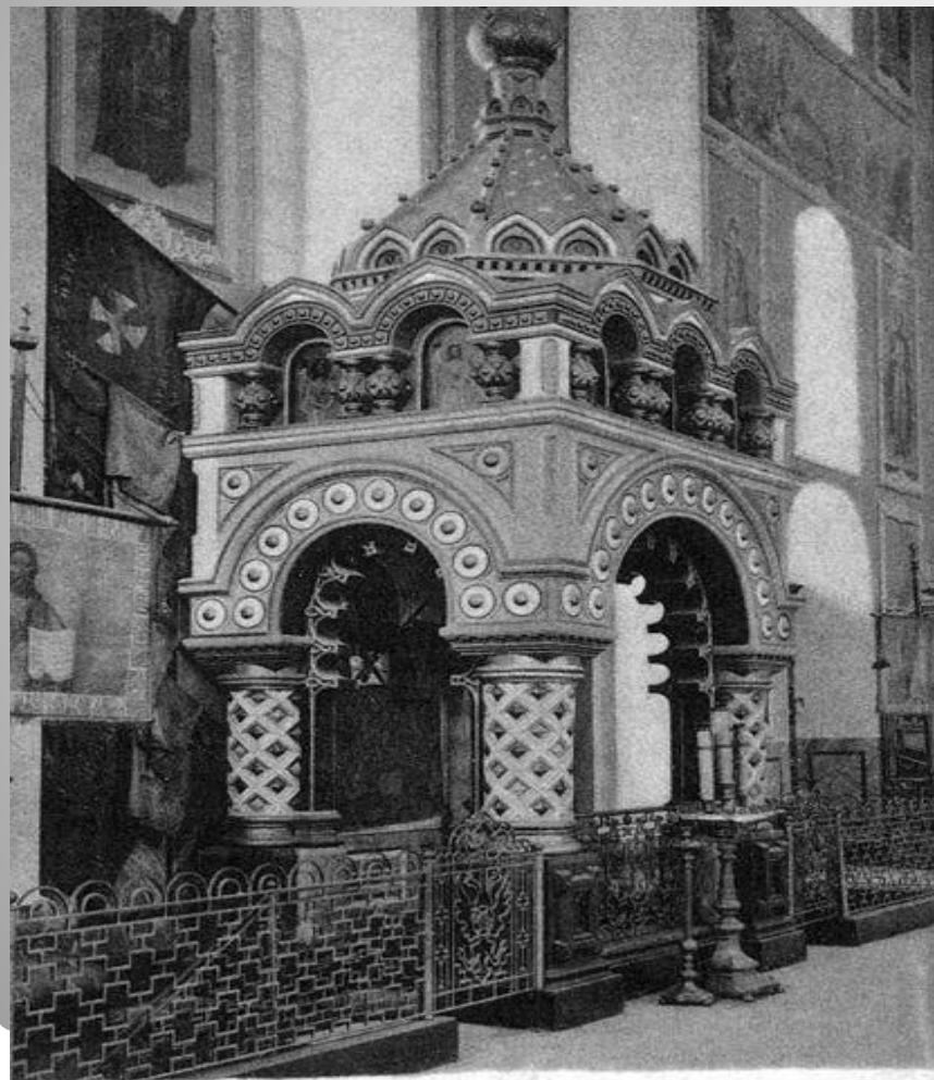
Гробница К.Минина в Михайлово-Архангельском соборе(г.Нижний Новгород)