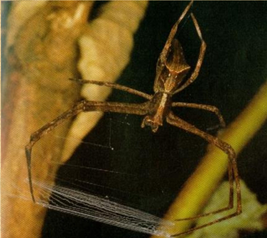
Паук, плетущий сеть.