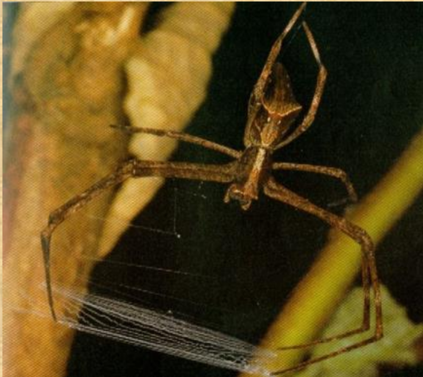
Паук, плетущий сеть.