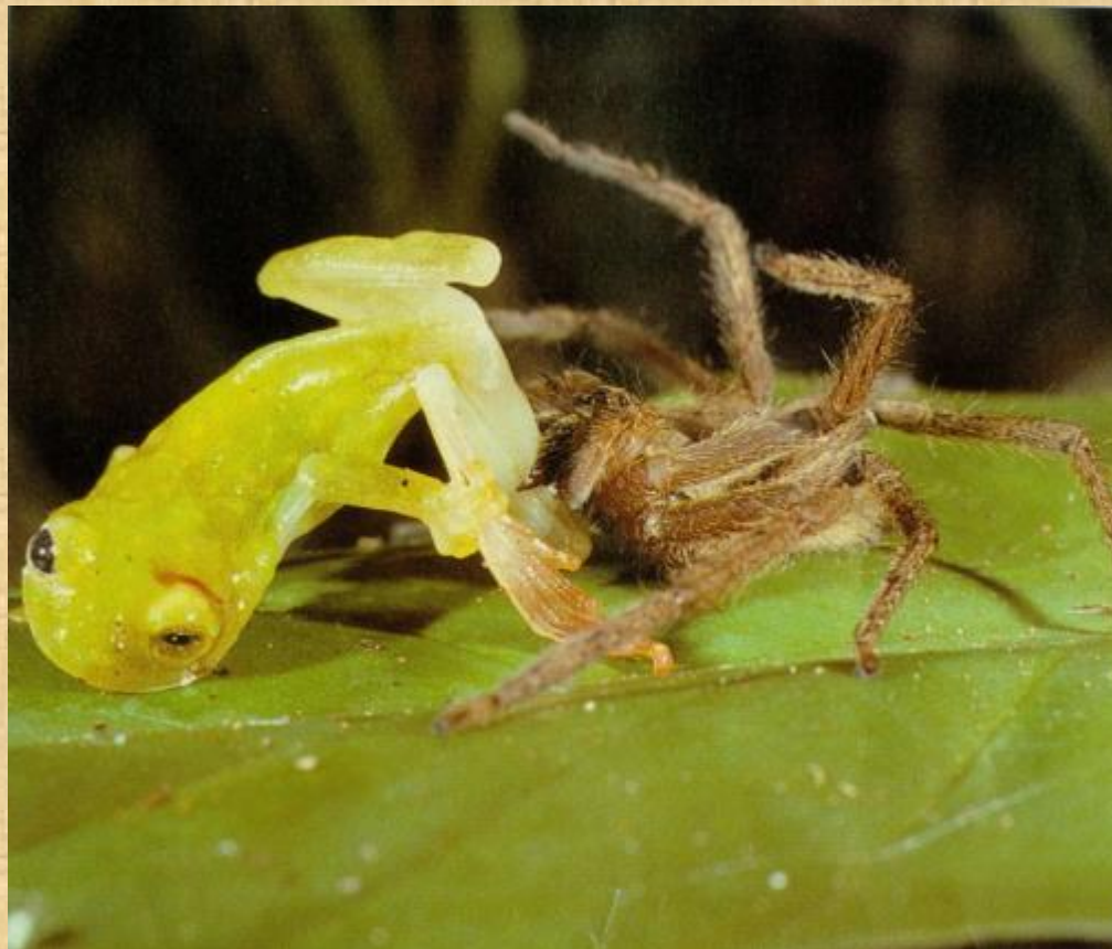
Паук, питающийся лягушками

Есть и большие пауки, которые едят птиц, мышей и лягушек.