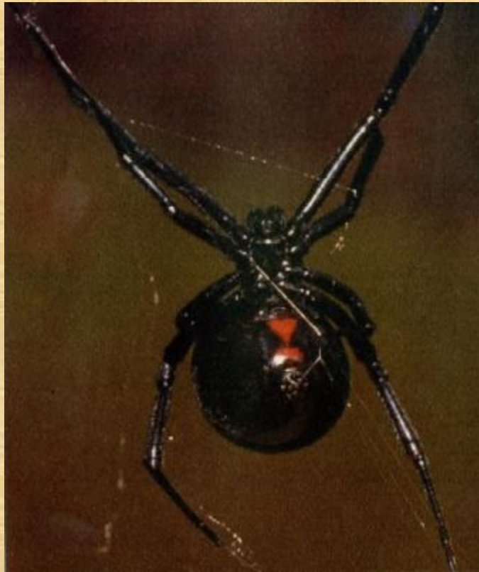
Самка черной вдовы

Самки пауков обычно крупнее самцов и более ядовиты.