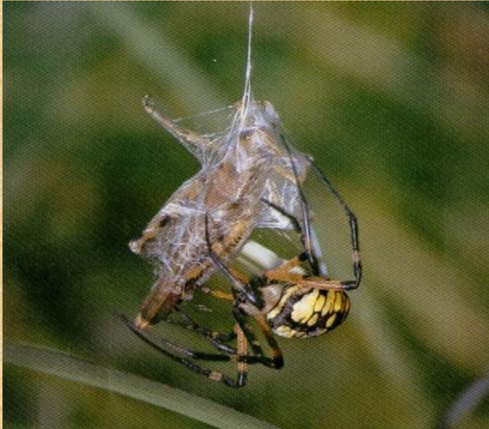
Садовый паук и кузнечик

Иногда пауки заворачивают пойманных насекомых в паутину, чтобы съесть позже.