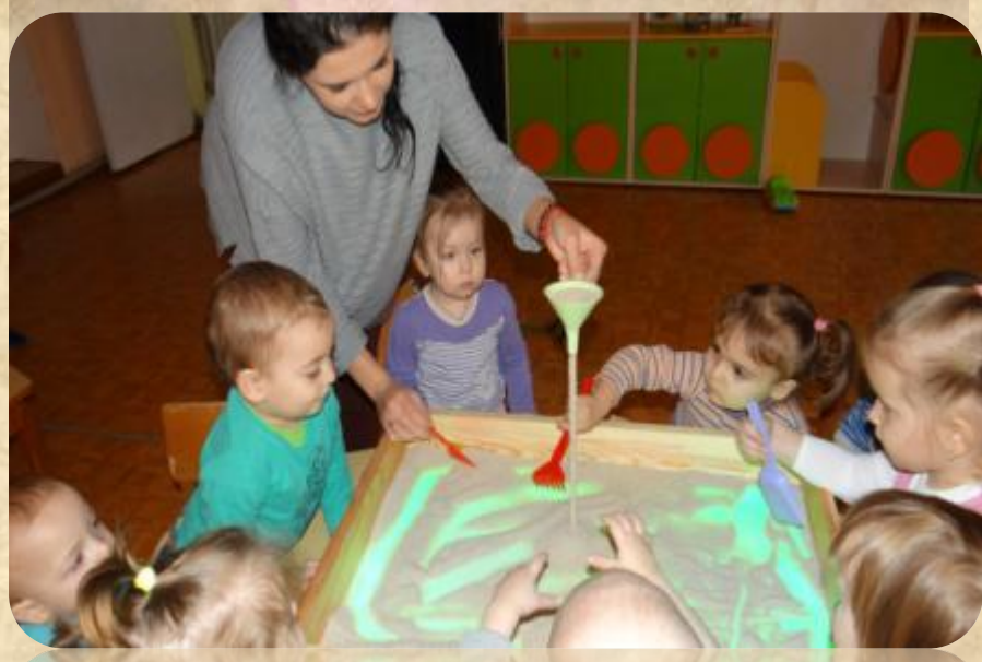
Следы на песке