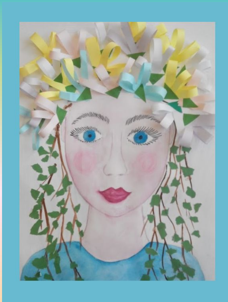
Коллективная аппликация «Весна-Волшебница»