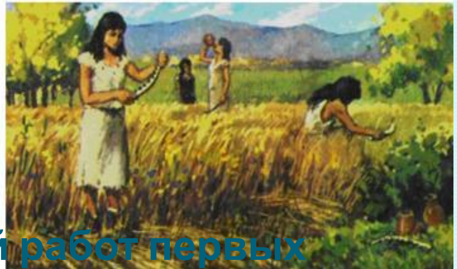
Рисунки стадий работ первых земледельцев