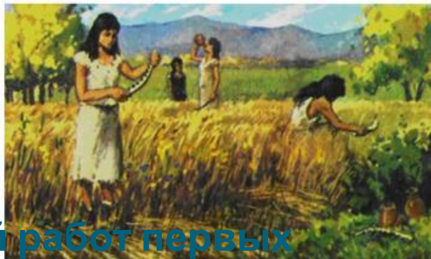
Рисунки стадий работ первых земледельцев