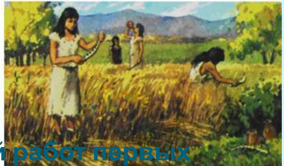
Рисунки стадий работ первых земледельцев