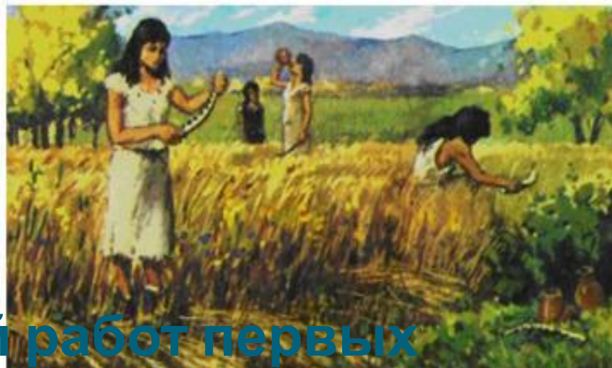
Рисунки стадий работ первых земледельцев