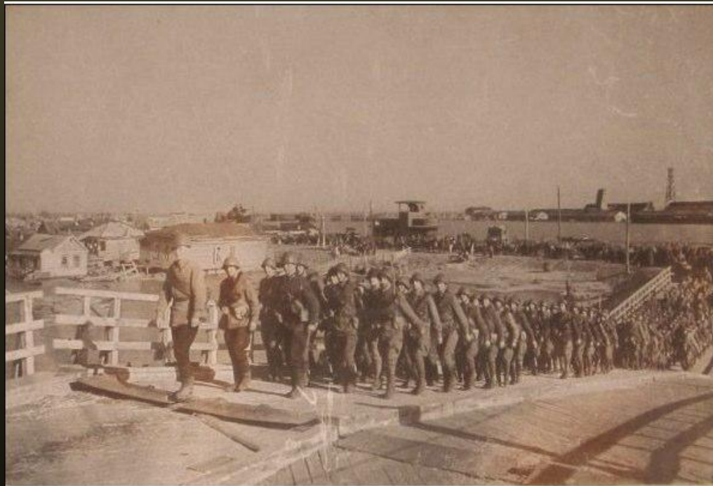
ЮЖНЫЙ ФРОНТ. НОЯБРЬ 1942 Г.

29 ноября после ожесточённых уличных боёв фашистские войска были выбиты из Ростова.