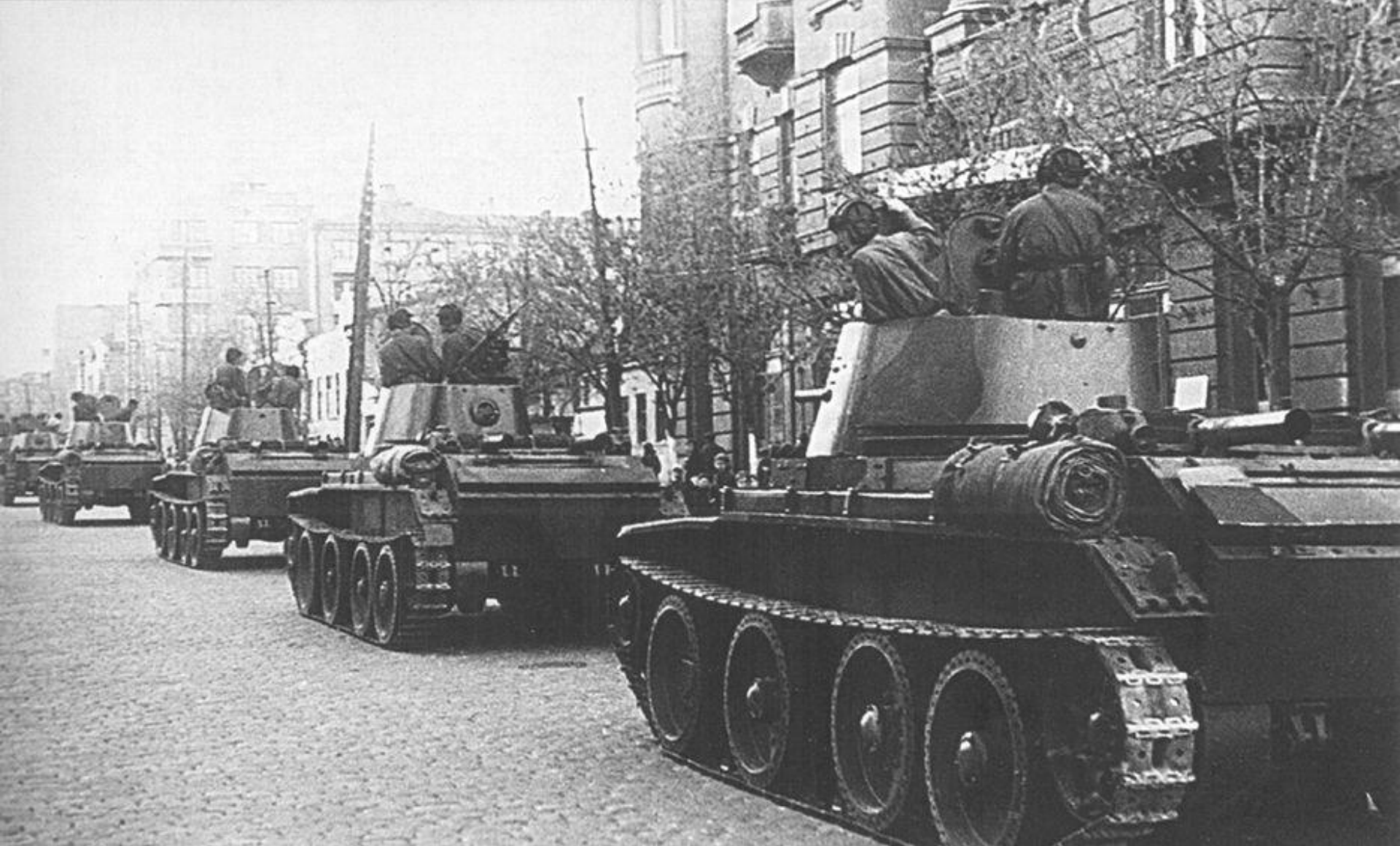
Колонна танков БТ-7 на Будёновском проспекте возле здания Горсовета (бывший дом Чирикова). Апрель или май 1942 года.