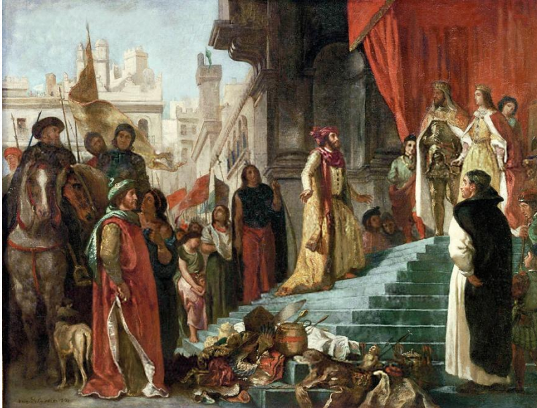
«Возвращение Христофора Колумба», картина Эжена Делакруа