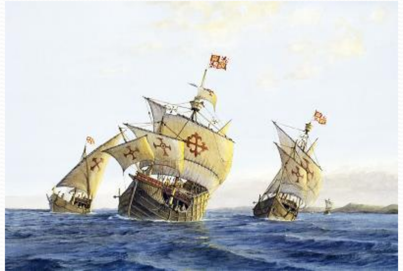
Корабли «Санта-Мария», «Нинья» и «Пинта»