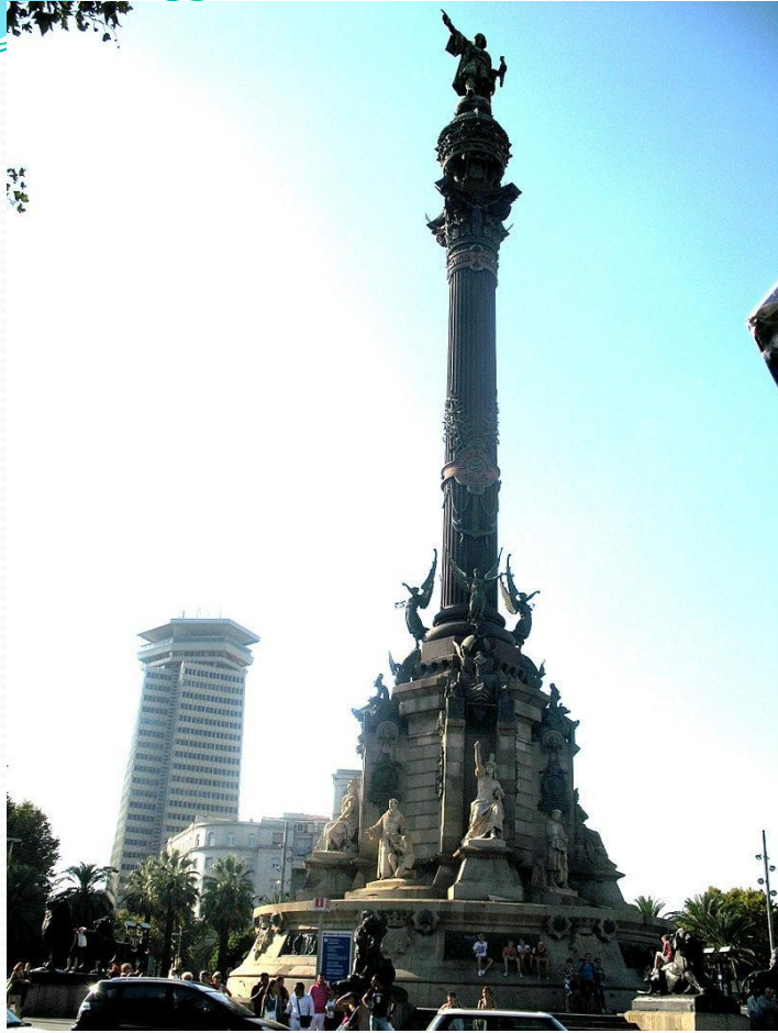
Памятник Х. Колумбу в Барселоне (Испания)

В честь Христофора Колумба названа страна в Южной Америке, река в Северной Америке. Памятники отважному мореплавателю установлены в Италии, Испании, в некоторых странах Латинской Америки и в США. Хотя Колумба в своё время называли «Адмирал моря-океана», умер он в бедности, так и не узнав, что открыл новый континент.