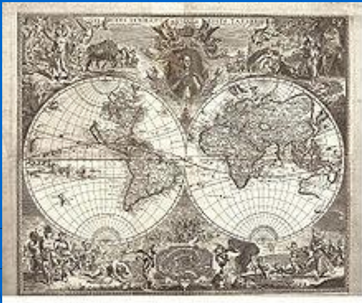
Российская карта мира 1707 года.

Пятьсот лет назад было совершено много Великих географических открытий. Путешествия Васко да Гамы, Фернана Магеллана и Христофора Колумба внесли множества исправлений в карты Птолемея. Все земли, которые открывались, были внесены в карту.