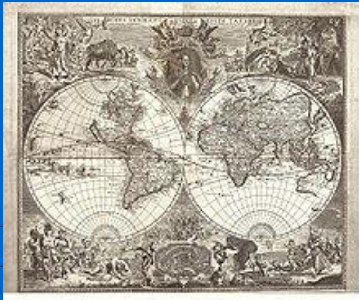
Российская карта мира 1707 года.

Пятьсот лет назад было совершено много Великих географических открытий. Путешествия Васко да Гамы, Фернана Магеллана и Христофора Колумба внесли множества исправлений в карты Птолемея. Все земли, которые открывались, были внесены в карту.