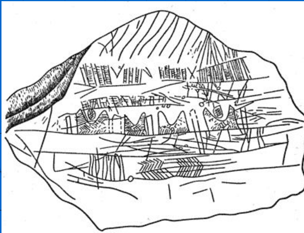
Рисунок местности на мамонтовом бивне

Первые простые картографические рисунки появились задолго до того, как люди научились писать. Археологи находят их на стенах пещер, бивнях мамонтов и деревянных табличках. Самые древние изображения местности созданы 10-15 тысяч лет назад.