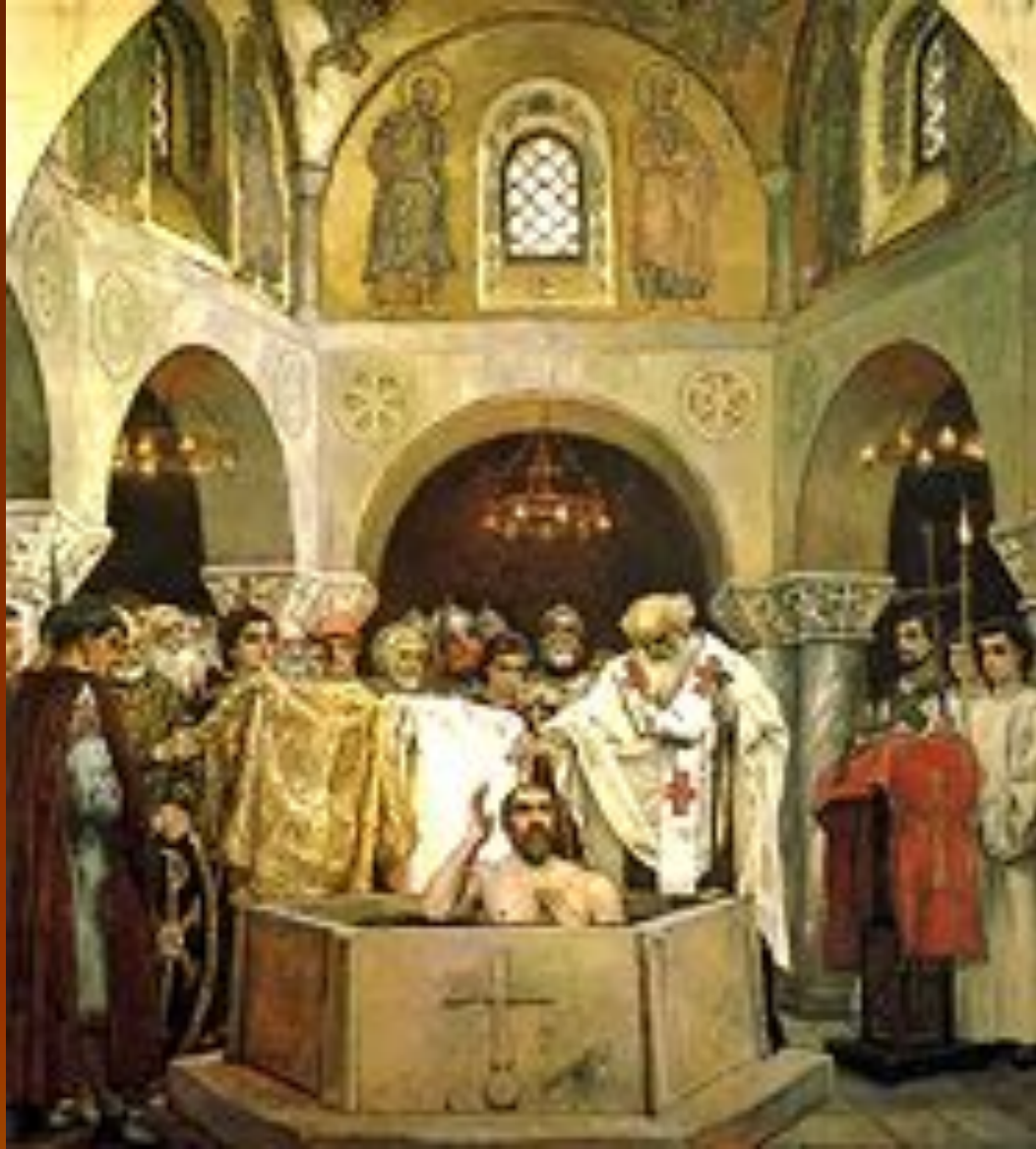
Фреска В.М. Васнецова. Крещение Владимира.