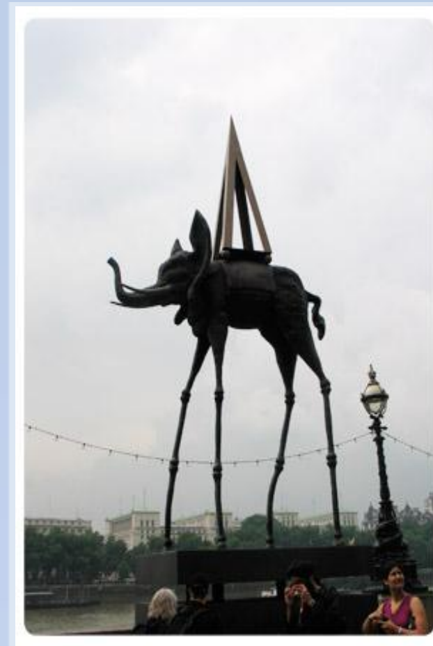
Слон. Скульптура. Лондон.

В Лондоне с 2000 по 2010 годы проходила выставка работ известного испанского художника Сальвадора Дали - "Вселенная Дали". Скульптура слона была установлена на набережной Темзы, у входа на выставку, рядом с колесом обозрения "Глаз Лондона". Этот слон на "тонких и длинных" ножках с пирамидой на спине - персонаж многих знаменитых картин художника. Животное, символизирующие силу и величие, Дали всегда изображал опирающимся на такие ноги с множеством коленных чашечек. Так художник хотел подчеркнуть ненадёжность и хрупкость того, что кажется мощным и незыблемым.