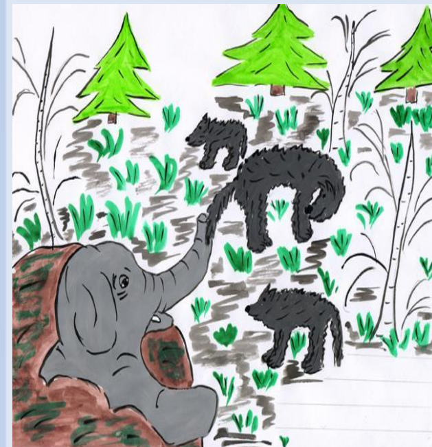
Рисунок Михалева И.

Шакалы поели всю падаль в лесу, и им нечего стало есть. Вот старый шакал и придумал, как им прокормиться. Он пошёл к слону и говорит: - Был у нас царь, да избаловался: приказывал нам делать такие дела, каких нельзя исполнить; хотим мы другого царя выбрать - и послал меня наш народ просить тебя в цари. У нас жизнь хорошее: что велишь, всё то будем делать и почитать тебя во всём будем. Пойдём в наше царство. А дальше слон был совсем глупый, поэтому и издох в болоте, шакалы пришли и съели его.